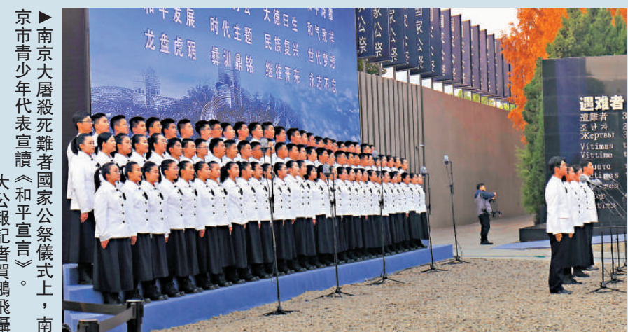
▲南京大屠殺死難者國家公祭儀式上，南京市青少年代表宣讀《和平宣言》。

1937年12月13日，侵華日軍在中國南京開始對我同胞實施長達四十多天慘絕人寰的大屠殺，製造了震驚中外的南京大屠殺慘案。1985年8月15日，侵華日軍南京大屠殺遇難同胞紀念館在南京落成。13日的國家公祭儀式在侵華日軍南京大屠殺遇難同胞紀念館集會廣場舉行，中外各界代表約8000人出席。公祭儀式於上午10時正式開始，全體人員奏唱國歌後，向南京大屠殺死難同胞默哀1分鐘。