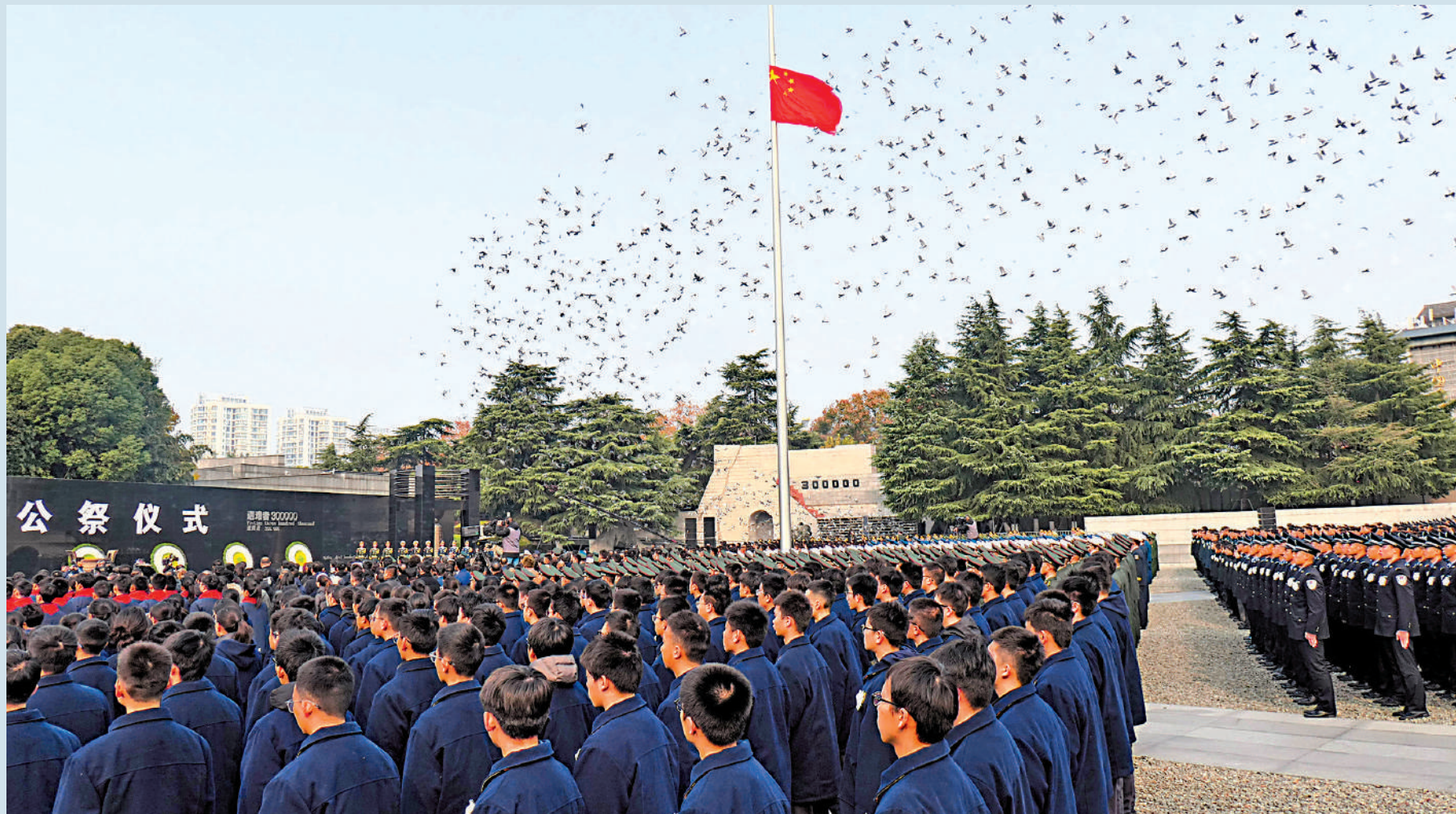
▲12月13日，南京大屠殺死難者國家公祭儀式現場放飛3000隻和平鴿，祈求世界和平。