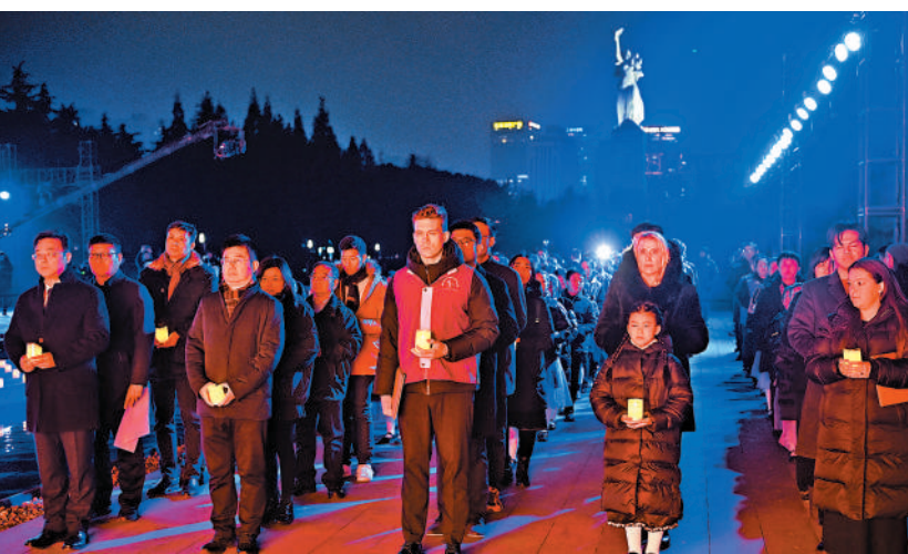
▲13日，各界人士在南京為南京大屠殺死難者舉行「燭光祭」。