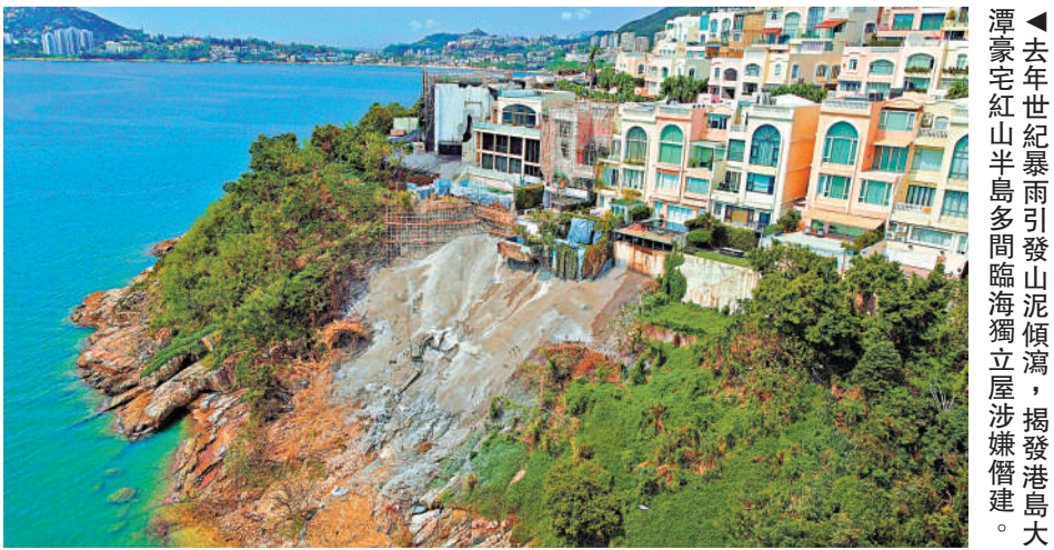
▲去年世紀暴雨引發山泥傾瀉，揭發港島大潭豪宅紅山半島多間臨海獨立屋涉嫌僭建。

舊樓失修石屎剝落傷及途人、大潭豪宅紅山半島有巨型僭建物的事件引起社會關注，針對不少違規業主收到僭建清拆令、驗樓通知後「懶懶閒」，發展局建議修訂《建築物條例》，對違規業主「加辣」懲處，包括引入新罪行，及引入公訴程序檢控，提高罰則，並引入定額罰款。不遵辦驗樓通知引入定額罰款6000元；涉及嚴重僭建罪成可被罰款最高100萬元；涉及建築安全的罪行，參考《職業安全及健康條例》引入可公訴罪行，最高罰則提升至1000萬元。 政府將展開為期兩個月的公眾諮詢，目標在2026年上半年向立法會提交修訂條例草案。有立法會議員贊成修例，認為有助減少業主拖延驗樓，承擔不遵從法例的責任和後果。 大公報記者 伍軒沛