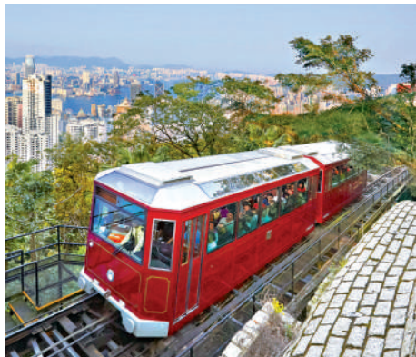
▲山頂纜車本月30日起調整票價。

【大公報訊】記者賴振雄報道：山頂纜車昨日宣布，本月30日起統一所有日期的票價，成人票價單程為76元，來回108元；小童及長者單程38元，來回54元。有網民認為，統一票價等同普通日子變相加價。