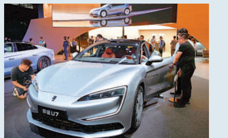
▲比亞迪今年銷量非常理想。

對於西方國家電動車發展不如理想，分析指新能源車所需的研發及成本高企，電池研發、生產設備、人員訓練等需要大量的資本投入，但西方國家經濟欠佳，加上在新能源車的技術不及中國，令愈來愈多消費者考慮購買性價比更高的中國車。因此，面對中國新能源車來勢洶洶，歐美只好以關稅來阻礙中國汽車進入，惟此非長遠之計。