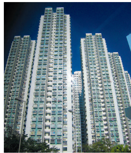
▲沙田第一城11月錄得42宗租務成交，為十大屋苑之中最多。

反觀，鯉魚涌康怡花園及東涌映灣園租務個案，按月分別下跌約27.3%及約27%；紅磡黃埔花園與觀塘麗港城亦分別跌約14.3%及約11.1%，黃埔花園月內錄12宗租務個案，為十大屋苑之中最少；至於荔枝角美孚新邨則維持19宗，按月持平。