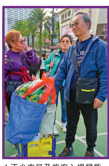
▲不少市民及旅客入場掃貨，部分更打算在這裏辦年貨。