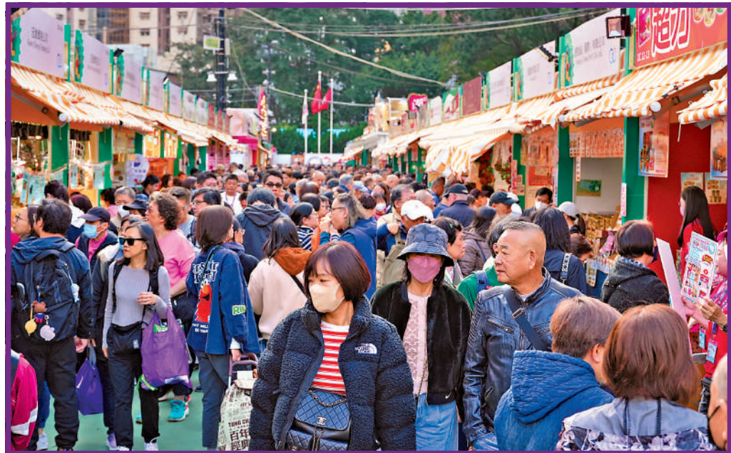
▲工展會昨日開鑼，場內人頭湧湧，主辦方表示，相信可以創造好成績。

工展會昨日起一連24日舉行，場內有約900個攤位，約400個參展商參與。昨日早上約9時半，會場各入口已有數十人排隊，有人說前日早上已到來，排隊逾24小時，為了第一時間入場掃貨。11時開放入場，近百人的龍「開鑼」入場，有市民說目標購買湯包、日用品等，預計花費數千元。