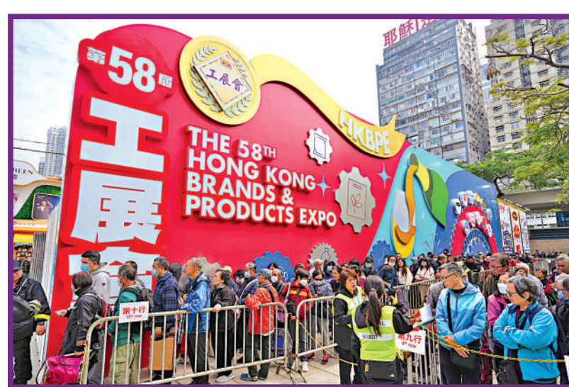
▲大批市民提前排隊等候，準備進場搶1元鮑魚福袋。

今屆工展會設有11大主題展區，從食品飲料、糧油麵食、參茸海味、保健產品以至各式各樣的廚具用品及家電，以及環球美酒。入場人士可把握三重購物優惠時段，選購500多款售價低至「1折」及「1元」的精選產品，盡興掃年貨。