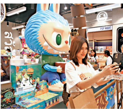
▲泡泡瑪特擁有強大的IP孵化和變現能力。

分析認為，議息結果公布前市場觀望氣氛漸濃，港股短期料於二萬關口上落，投資者可部署息口敏感度較低股份。內地消費政策發力，可留意泡泡瑪特(09992)及南方航空(01055)，另大市成交及新股轉旺，港交所(00388)將直接受惠。