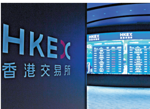
▲專家料大市仍有力再向上，最率先受惠股份將會是港交所。