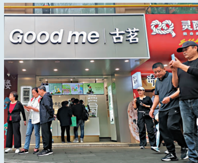
▲招股書顯示，古茗擁有1.35億名小程序註冊會員。

截至去年末，古茗的門店網絡涵蓋9001家門店，較2022年增加35%。截至今年9月30日，古茗門店數量已達9778家。