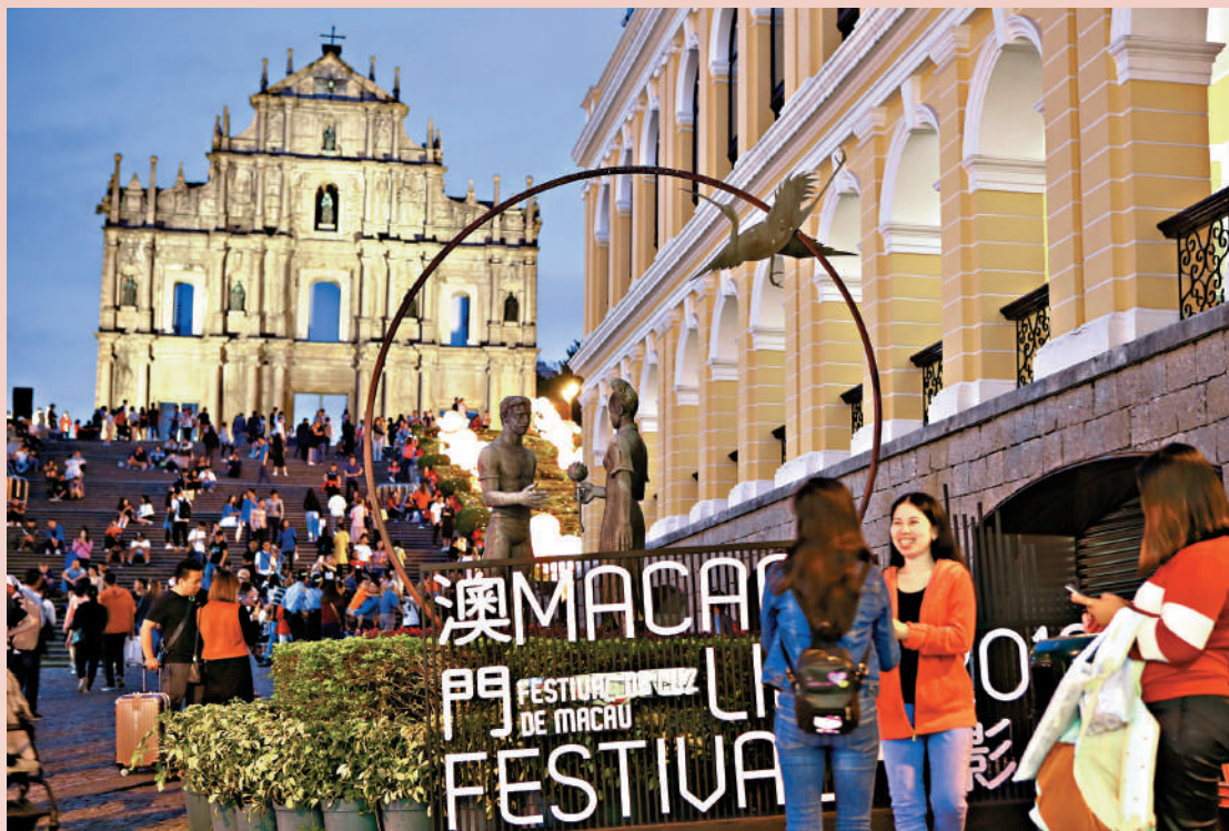
▲澳門回歸祖國25年以來，各項主要經濟指標闊步邁入全球前列，民生福祉大大提升，創造了一個新的「澳門奇跡」。

回歸祖國25年來，在「一國兩制」方針指引下，在中央政府的大力支持下，澳門實現向現代化國際都市的華麗轉身。澳門特區政府與社會各界攜手並進，積極探索適合自身的發展路徑，在經濟、民生等領域取得顯著成就。與此同步，澳門不斷深化與內地的交流合作，深度融入國家發展大局，在以中國式現代化全面推進強國建設、民族復興的時代偉業中，與祖國同進步、共繁榮，展現前所未有的豪邁情懷。