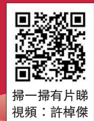
掃一掃有片睇 視頻：許焯傑

數字是最有力的證明：非博彩業在澳門本地生產總值中的比重正逐漸提升，到2023年已超過六成。