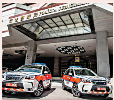
▲澳門保安司司長辦公室表示，多個保安範疇部門已開展行動，維護回歸二十五周年活動期間良好的社會治安環境。

保安司表示，當局已提前做好應對慶典及大型活動的準備工作，將根據活動的規模、參與人數、對社區可能造成的風險等因素，按實際情況啟動跨部門聯合行動指揮中心，留意活動實時動態及社區整體狀況，及時作出警力調度。當治安警察局收到相關統籌單位通知舉辦演唱會或其他大型活動後，會對活動舉辦場地進行風險評估。活動當