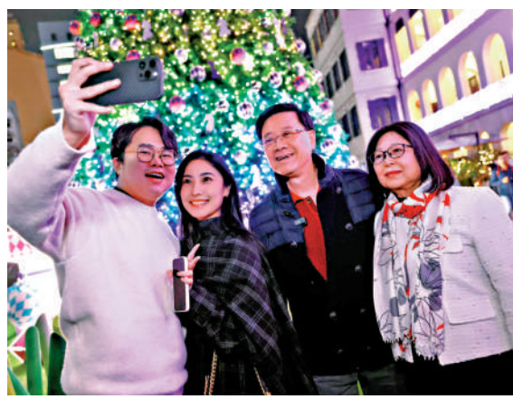
▲行政長官李家超昨晚偕夫人林麗輝落區，在中環大館與遊客合照。