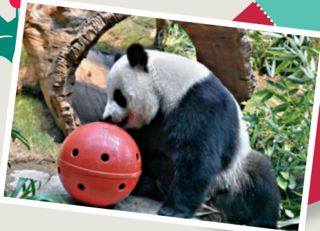
▲海洋公園為大熊貓設計動腦活動。

另外，大熊貓「盈盈」誕下的一對龍鳳胎「家姐」和「細佬」，現時已經四個月大，發育良好，前肢有力，相信很快便能學會站立，甚至走路，預料在農曆新年前後，可以公開亮相。