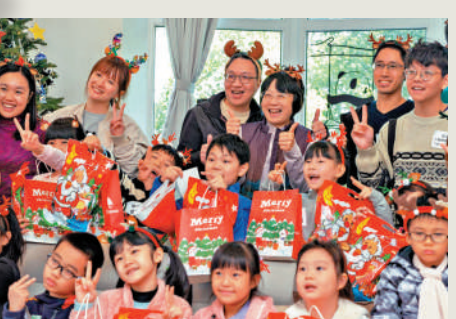
▲林定國與太太邀請小朋友到官邸舉行聖誕派對。

律政司司長林定國與太太於上週六（14日），邀請一班來自深水埗社區客廳的小朋友，到官邸舉行聖誕派對。小朋友對官邸環境充滿好奇，主動發問並拋出各種有趣的IQ題。林定國笑稱「幸好絕大部分的考題我都答上，一些太過『抵死』的則有點難度。」各款遊戲中，「大電視職業猜猜猜」是活動高潮所在，小朋友模仿律師、醫生、廚師等不同職業，非常「生鬼」。