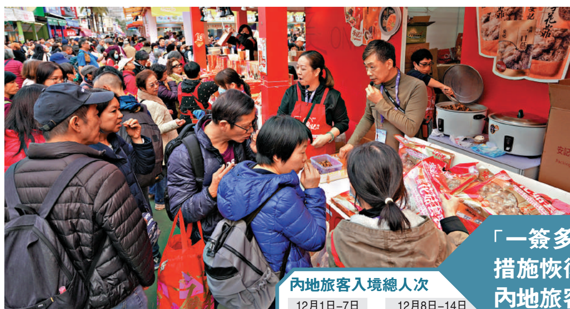
▲維園工展會場面熱鬧，參展商表示，銷售額勝預期。

深圳居民「一簽多行」簽注恢復實施至今半個月，內地訪港旅客人數持續上升，上週六（14日）錄得逾16.1萬內地旅客來港，當中近10.6萬旅客經與深圳連接的陸路口岸來港，較「一簽多行」恢復前的星期六，增加22%。