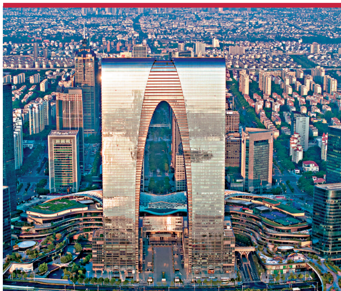
▲301.8米高的東方之門是世界最高拱門式建築，矗立在蘇州工業園區星港街199號，登上東方之門，278平方公里的蘇州工業園區盡收眼底。