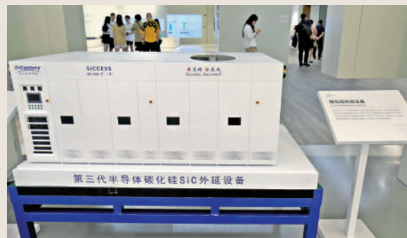
▲園區依託納米城為產業發展主陣地，規劃布局了第三代半導體等發展領域。圖為蘇州工業園區企業研發的第三代半導體碳化硅外延設備。

包括上述產業在內，蘇州工業園區正在形成由6個重點產業集群和23條重點產業鏈組成的「623」產業體系，不僅原有的優勢產業進一步壯大，還湧現出很多新興產業集群。