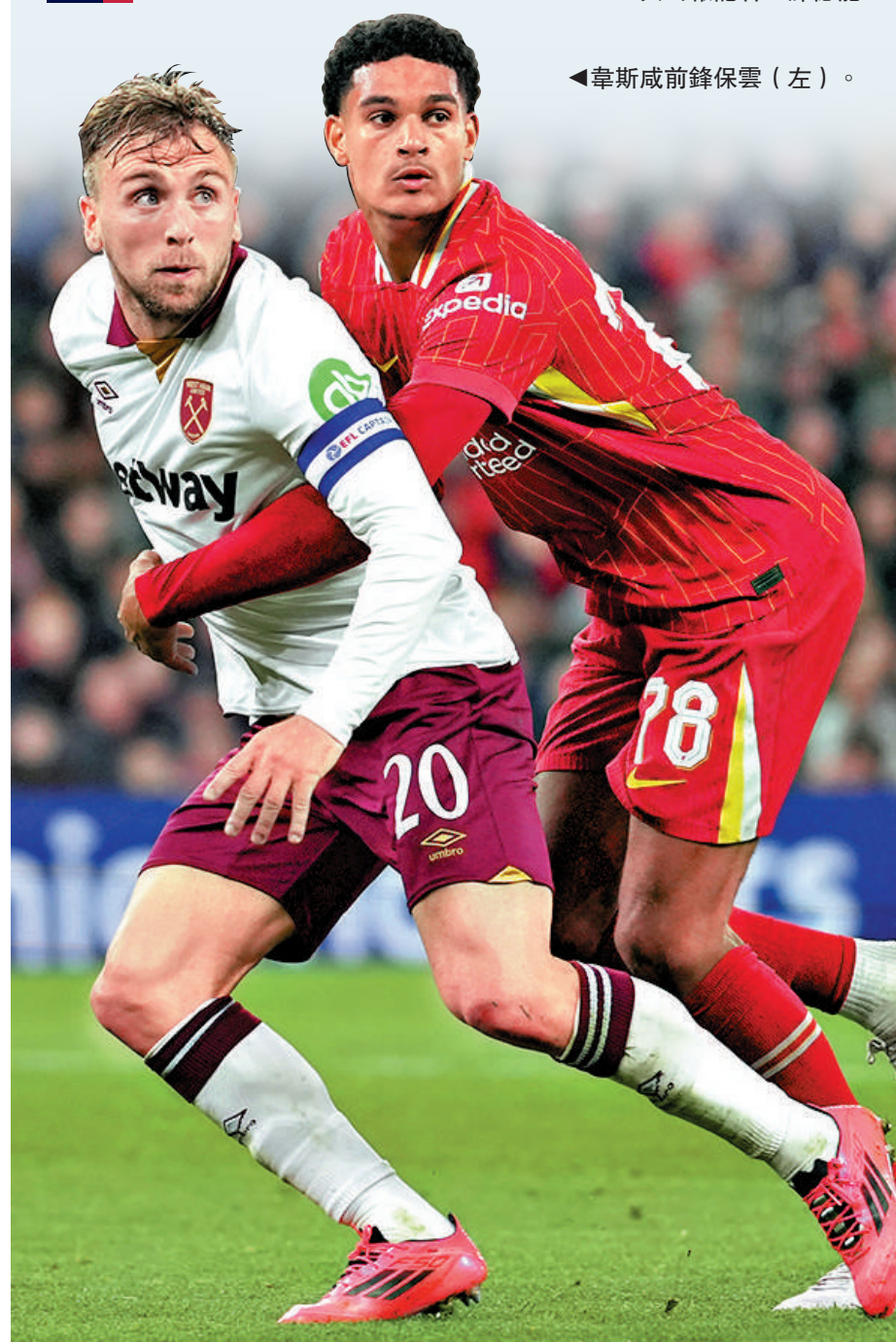
◀韋斯咸前鋒保雲（左）。▶