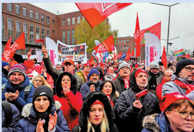
德國民眾最擔心經濟問題。圖為大眾汽車僱員9日參加示威，抗議該公司的減薪裁員計劃。