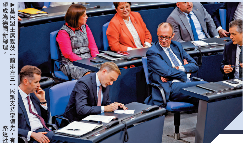
基民盟主席默茨(前排左三)民調支持率領先，有望成為德國新總理。