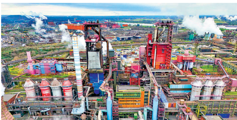
德國工業面臨成本上漲、競爭力下降等挑戰。

● 哈貝克11月8日表示將代表綠黨競選總理。他主張採取立法手段及提供高額補貼以實現經濟轉型、應對氣候危機，以及向烏克蘭提供「金牛座」導彈。哈貝克的民調支持率為29%，但綠黨的支持率僅為14%。