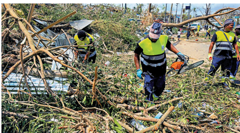
救援人員15日在馬約特島清理被風暴吹倒的樹木。

際死亡人數難以統計。法國代理內政部長勒塔約表示，馬約特島自1934年之後沒有發生過如此嚴重的氣候災難。法國軍方已派出運輸機運送救援物資，內政部調派1600名警察和憲兵協助救災，並計劃增派約800名救援人員。13日剛上任的