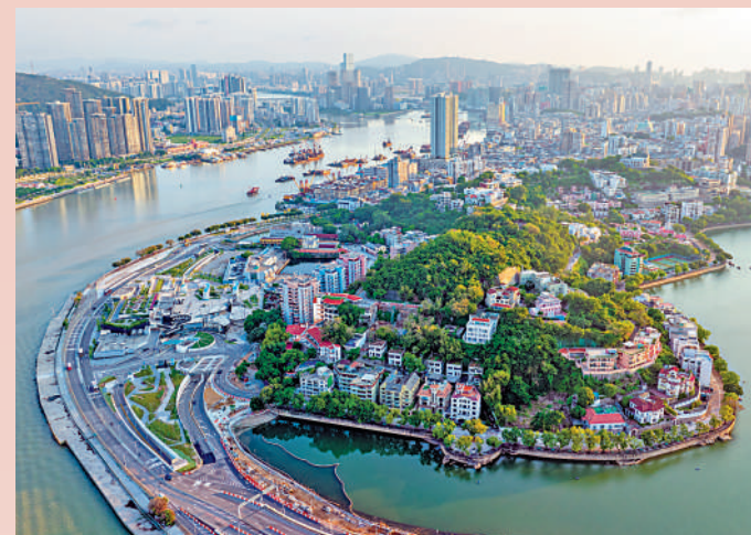
▲在中央大力支持下，澳門歷屆特區政府將促進人民福祉作為施政重心，以提振經濟和促進就業為重要任務。