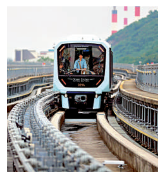
▲慶祝澳門特別行政區成立25周年，澳門輕軌於12月20日開放予乘客免費搭乘列車。

澳門輕軌目前共有3條營運路線，包括往返媽閣站和氹仔碼頭站的氹仔線，連接協和醫院站與石排灣站的石排灣線，以及12月2日剛剛通車、連接蓮花站至橫琴站的橫琴線。