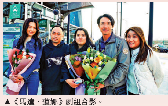
▲《馬達·蓮娜》劇組合影。