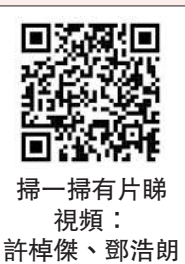
掃一掃有片睇 視頻：許傑偉、鄧浩朗

▲澳門回歸25周年，處處洋溢喜慶祥和氣氛，旅客開心在大三巴前拍照留影。