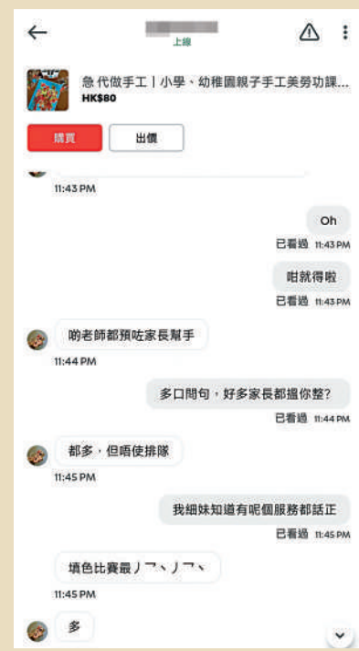
▲幼稚園美勞「槍手」直指光顧的家長不少，並以填色比賽最多。