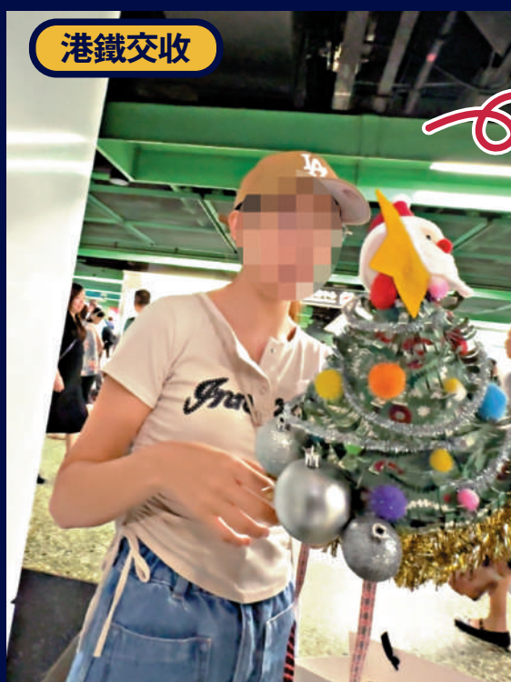
▲「槍手」製作的聖誕帽後，在港鐵站交收。