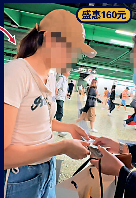
▲聖誕帽總值160元，「槍手」收取80元尾數。