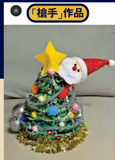
▲「代勞」完成的聖誕帽。