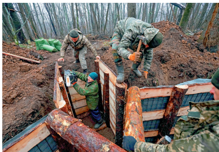
▲烏軍在前線失利，基輔試圖通過暗殺打擊俄軍士氣。圖為烏軍11日在哈爾科夫挖戰壕。