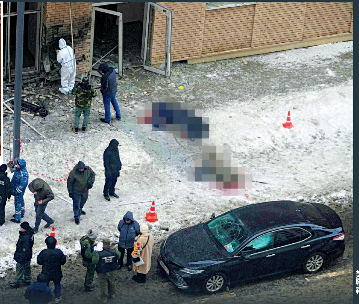
▲基里洛夫及其助手17日在莫斯科一宗爆炸事件中身亡，基輔宣布對此事負責。

俄羅斯武裝力量輻射、化學和生物防護部隊（三防部隊）主要負責保護俄武裝力量免遭大規模殺傷性武器的影響，以及通過使用特種軍事裝備消除大規模殺傷性武器造成的後果。 大公報整理