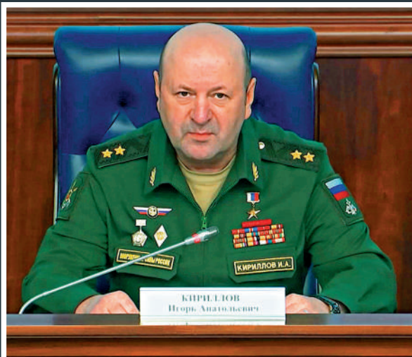
▲俄羅斯武裝力量輻射、化學和生物防護部隊司令基里洛夫上月出席記者會。

話你知 基里洛夫中將出生於1970年，曾在蘇聯武裝部隊服役，2017年被任命為俄羅斯武裝力量輻射、化學和生物防護部隊（三防部隊）司令。新冠疫情期間，他領導了俄國防部冠狀病毒RNA檢測試劑的開發工作。