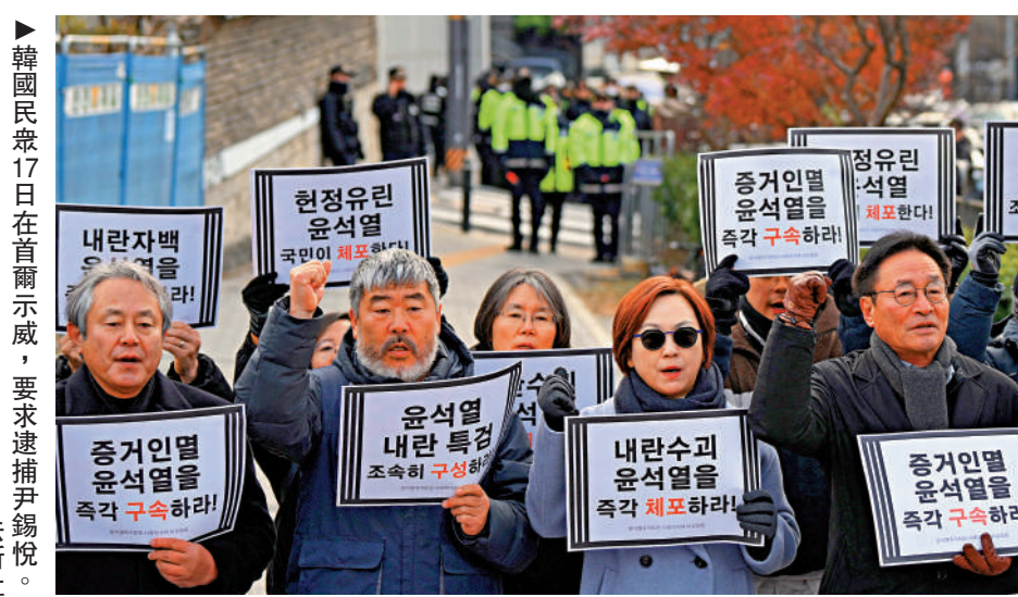
▲韓國民眾17日在首爾示威，要求逮捕尹錫悅。

最大在野黨共同民主黨正推進於23日至24日對目前空缺的3名憲法法院法官候選人召開人事聽證會。執政黨國民力量黨鞭權性東稱，代行總統職權的國務總理韓德洙無權任命新的法官。共同民主黨批評他的說法「毫無根據」。