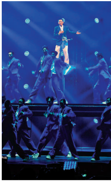
▲劉德華演唱《今天Today》為演唱會揭開序幕。