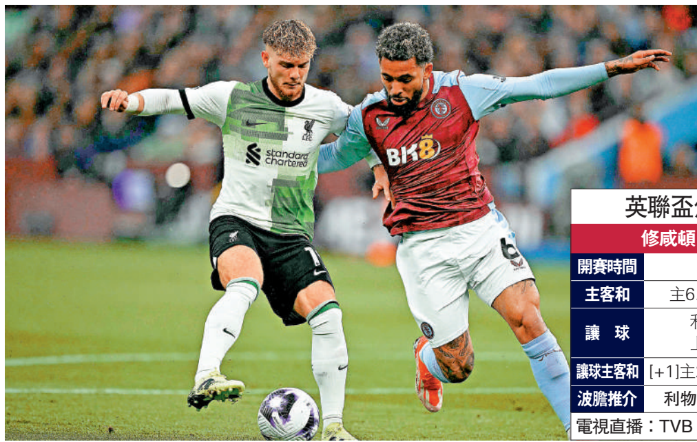
▲利物浦翼鋒艾利洛（左）。