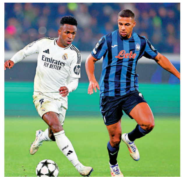
▲皇馬前鋒雲尼斯奧斯（左）。