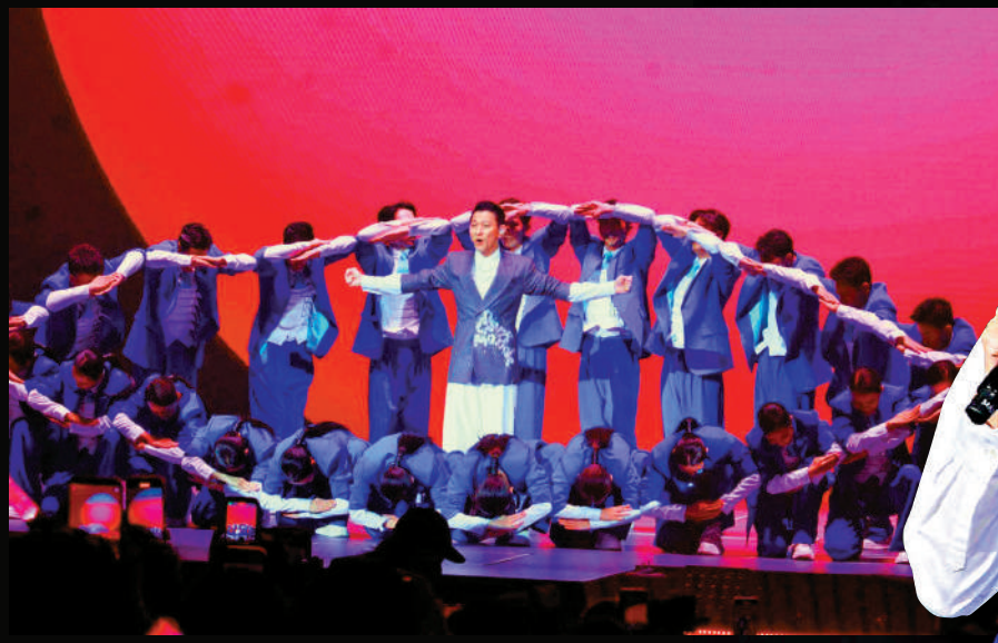
▶舞蹈造型設計獨特。