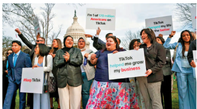
▲TikTok支持者今年3月在國會山抗議「不賣就禁」法案。

在海湖莊園舉行的記者會上表示，會再評估TikTok相關問題。「我們會研究一下TikTok，你知道，我對TikTok有好感。」他還提到，自己在這次大選獲得不少年輕人支持，而TikTok核心用戶主要由年輕人組成。