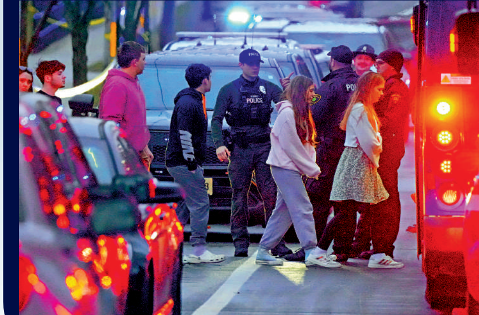
▲槍擊案發生後，「豐盛生命」學校學生在警方護送下乘巴士離開。