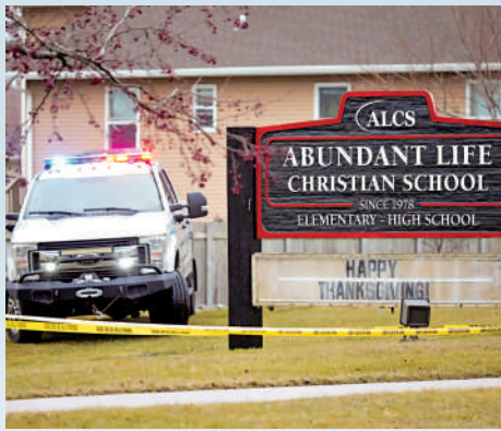
▲警車停在「豐盛生命」基督教學校外。

美國威斯康星州麥迪遜市一所學校16日發生槍擊事件，造成2人死亡、6人受傷，其中兩人傷勢嚴重。槍手為該校一名15歲女學生，她作案後自殺身亡。根據美媒統計，這是美國今年第83宗校園槍擊案，數量為2008年以來最多。美國槍支暴力氾濫，今年有超過1.6萬人死於槍擊案。隨著反對控槍的美國當選總統特朗普即將上台，外界擔憂槍支暴力氾濫情況，恐進一步惡化。