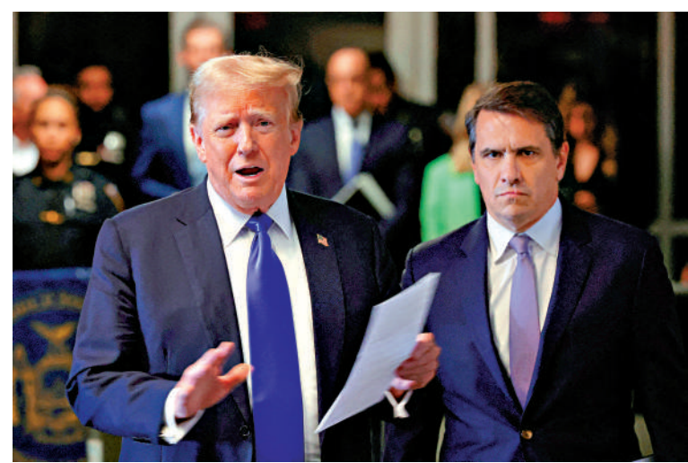
▲今年5月，特朗普（左）與律師因「封口費」案在紐約出庭。

弗里蘭辭職當天，其領導的財政部公布秋季經濟報告，顯示加拿大2023-2024年度預算赤字達619億加元，遠高於一年前設定的401億加元目標。弗里蘭辭職後，特魯多所在的自由黨開會，至少7名議員要求特魯多下台，但未獲他回應。弗里蘭曾視特魯多的接班人，她的辭職加劇政府動盪，目前已有6名內閣部長表示不會參加下屆大選，住房部長弗雷澤周一以家庭原因為由辭職。