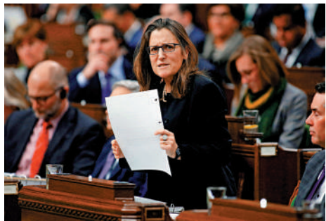
▲加拿大財政部長弗里蘭。路透社

【大公報訊】綜合路透社、《華爾街日報》報導：加拿大副總理兼財政部長弗里蘭16日宣布辭去內閣職務，原因是與總理特魯多在財政政策上存在分歧。特魯多