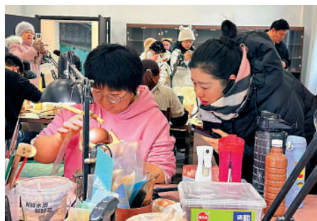
作團了解「紫砂一把壺」的參訪過程。