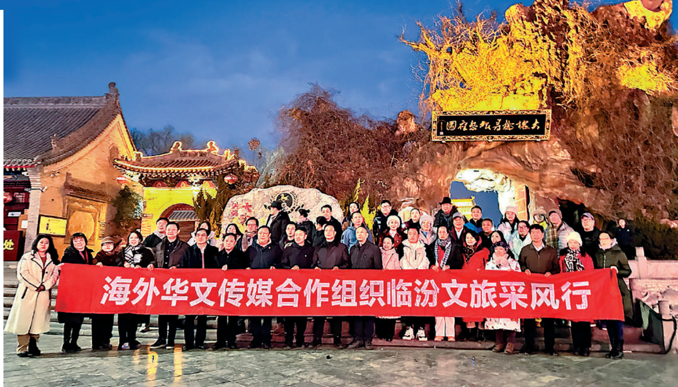
▲日前，「海外華文傳媒合作組織臨汾文旅採風行」走進山西洪洞大槐樹景區，開啟一場意義非凡的探源尋根之旅。

活動雖落下帷幕，但傳播的火種永不熄滅。山西臨汾的故事，如同清泉，通過海外華文媒體這座橋樑，潺潺流向世界每一個角落。它帶着黃土高原的厚重，攜着華夏文明的璀璨，讓全球的目光聚焦於這片古老而又充滿活力的土地。歐中之聲副總編輯林奕賢表示，「一路走來，交匯着歷史、文化、自然，這是一次流動的盛宴，無論我們走到哪裏，臨汾都與我們同在，正所謂所有的旅行都是出發，到了臨汾咱是回家！」