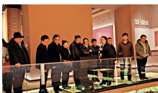
▲在臨汾陶寺遺址博物館，參訪團聆聽工作人員講解。