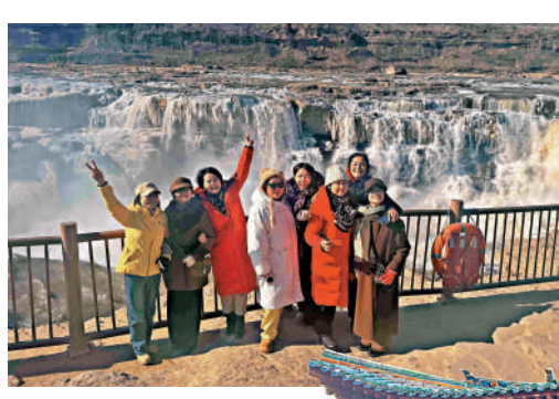
▲在黃河壺口瀑布前，參訪團打卡拍照，合影留念。