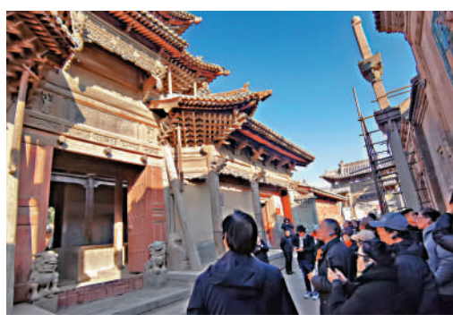
▲參訪團在汾城古鎮裏的城隍廟門樓前駐足欣賞。