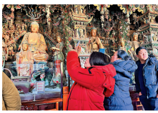
▲走進隰縣小西天景區，參訪團被懸塑作品深深吸引。