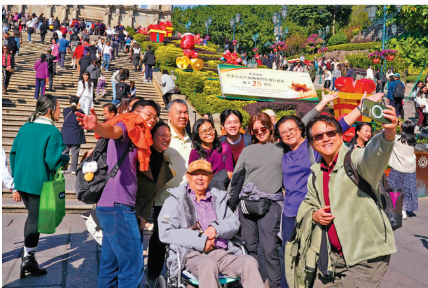
▲澳門迎來回歸25周年，各方面發展均有飛躍進步，市民臉上洋溢幸福與自豪。

到澳門與內地的聯繫日益緊密。在中央政府授權和支持下，中國澳門與120多個國家和地區建立穩定的經貿文化關係，澳門參加國際組織和機構的數量增至190多個，已獲得147個國家和地區免簽證或落地簽證待遇。對此，92.5%的受訪者認為背靠祖國、聯通世界是澳門得天獨厚的顯著優勢。