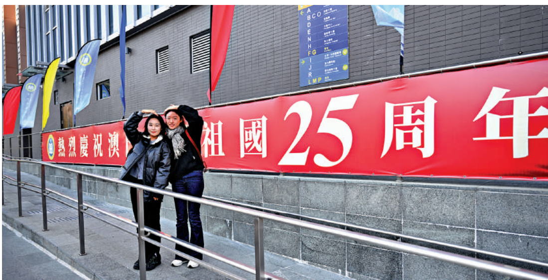
▲澳門街頭洋溢節日喜慶氣氛，有大學生在祝賀橫幅前拍照留念。

回歸後的澳門，在經濟上實現了多元化發展，從以博彩旅遊業為主逐步拓展到文化創意、金融服務、中醫藥等多個領域，經濟活力不斷增強，城市建設日新月異，基礎設施不斷完善，居民生活水準顯著提高。文化方面，澳門成功舉辦了一系列國際文化活動，東西方文化在這裏交融共生，多元文化魅力愈發凸顯。這些成就不僅是澳門自身發展的生動體現，也為「一國兩制」的成功實踐提供了有力證明。