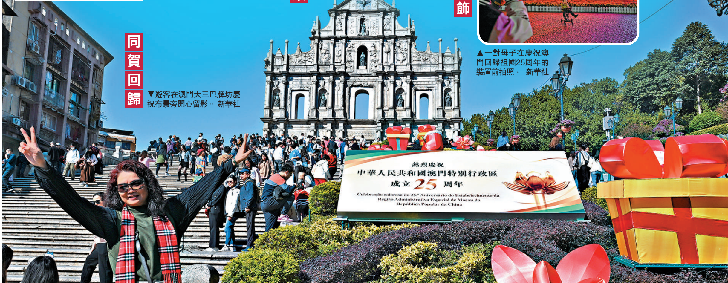
▼遊客在澳門大三巴牌坊慶祝布景旁開心留影。