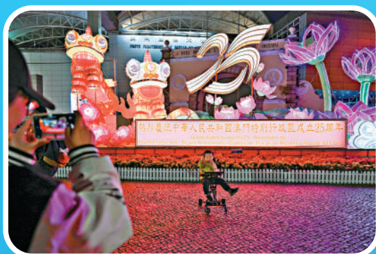
▲一對母子在慶祝澳門回歸祖國25周年的裝置前拍照。