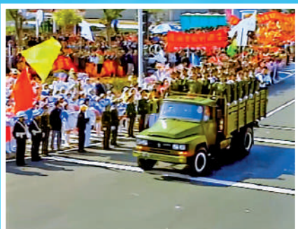
中國人民解放軍進駐澳門 珍貴畫面

「我們全部居民都衷心歡迎解放軍,支持解放軍!」1999年12月20日,中國人民解放軍駐澳門部隊依法進駐澳門。看解放軍進駐澳門珍貴畫面,官兵軍姿挺拔,五星紅旗在澳門上空迎風飄揚! 視頻截圖