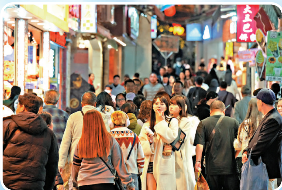
▲澳門喜氣洋洋迎回歸25周年,晚上市面比平日熱鬧。