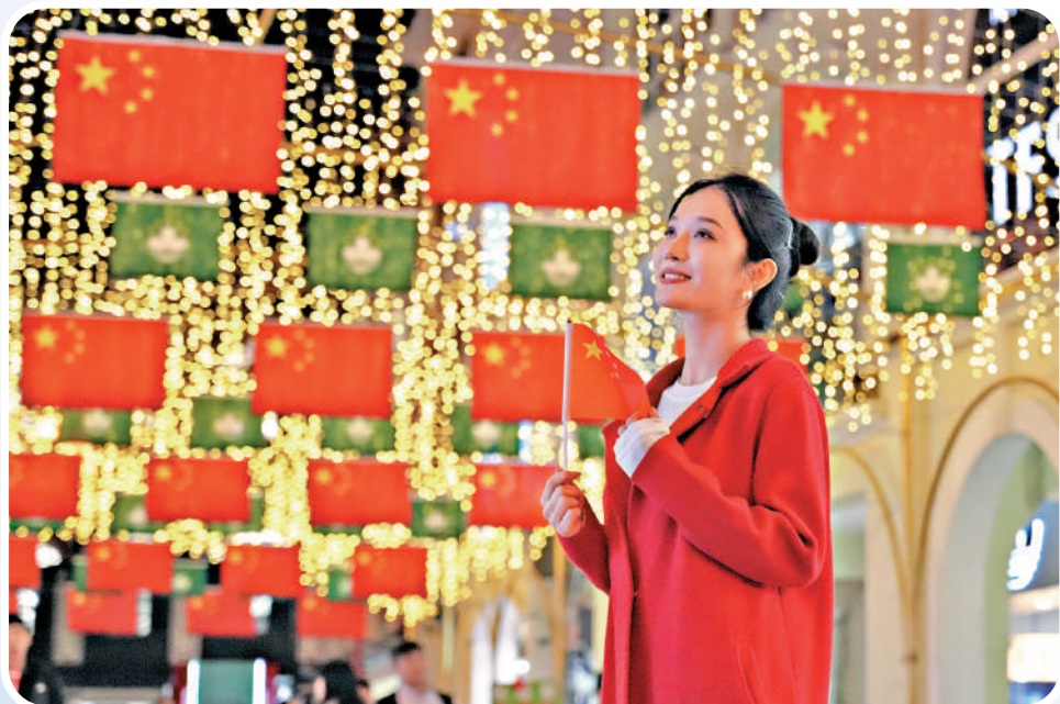
▲拿着國旗在旗海燈飾下打卡,特別美麗。