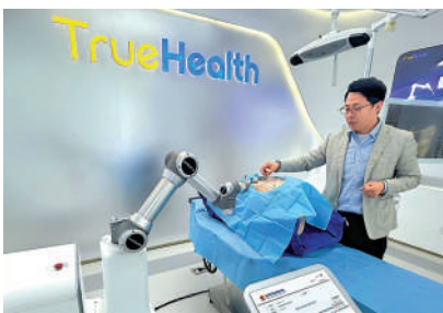
▲真健康（廣東橫琴）醫療科技有限公司研發的穿刺手術導航定位系統。