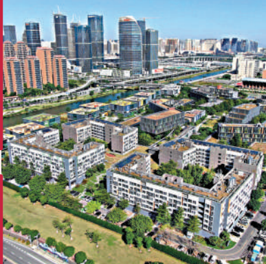
▲橫琴粵澳深度合作區成立三年多，澳人澳企快速增長、創新要素加快集聚、「四新」產業加快發展。圖為橫琴澳門青年創業谷。