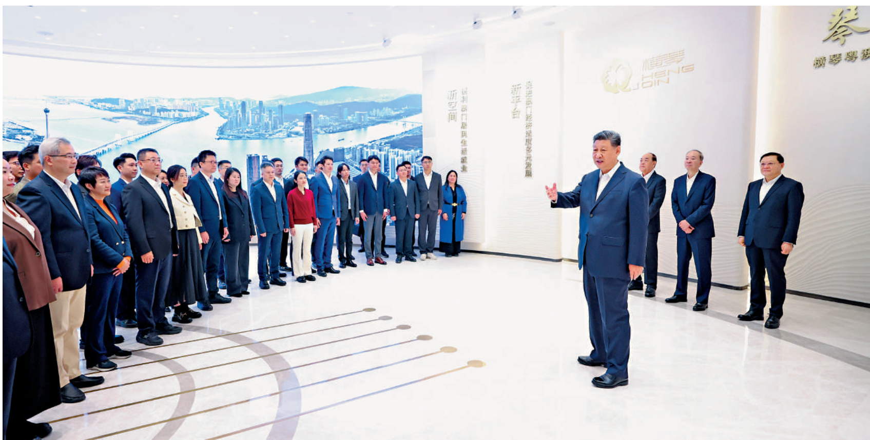
▲習近平主席在橫琴天沐琴台展示廳考察時，同參與橫琴粵澳深度合作區規劃、建設、管理、服務等各方面代表親切交流。