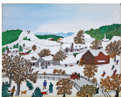
摩西奶奶本名安娜·瑪麗·羅伯遜，摩西。她和丈夫托馬斯曾是美國內戰後的南方佃農，生活艱難。晚年的摩西有了些許閒暇時間，於是開始

既然不用擔心應付不來，我就放心地邁步向前。道路果然平坦舒順，只期待可以盡快到達目的地，拍照休憩，享受不太費力又有益身心的假期。然而一個又一個小時過去，水庫堤壩依然未見蹤影，連帶路的人也感奇怪，猜想我們可能錯走了跟原定路線相反的方向，所以需要步行多一倍