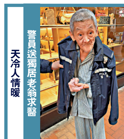
警員送獨居老翁求醫 天冷人情暖

運輸及物流局表示，政府會負責項目的道路基礎設施工程，餘下工作則由同一個機構負責，包括在約20至30年的合約期內，設計及建造營運系統所須的車廠及控制中心，並在合約期結束時，按需要將良好運行的系統移交政府。將來的營運商須以商業模式營運系統，並提供公眾可接受的票價。如有需要，政府會探討項目的資助方案，包括批出在擬建車廠用地的物業發展權。意向書的截止時間為2025年2月28日中午12時。