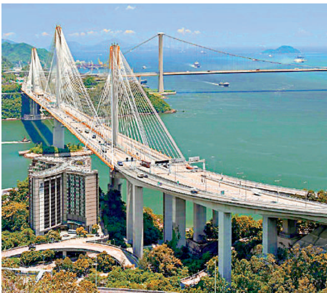
▲汀九橋南行線於本月29日起試行智慧公路先導計劃。