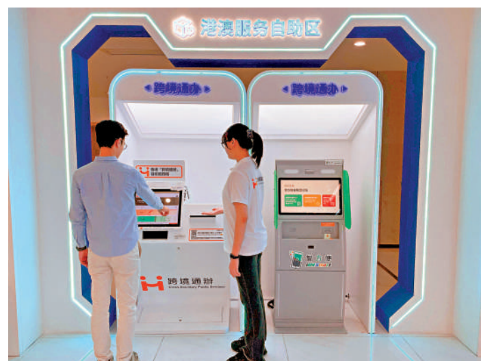
▲香港「跨境通辦」自助服務機（左）現時提供70項政務服務，在內地工作及生活的香港市民可以一站式申辦各項香港政務服務，同時透過「智方便」自助登記站（右）登記「智方便+」。

惠州市市民服務中心亦同時設有「智方便」自助登記站，便利在內地工作及生活的香港市民登記「智方便+」，直接以「智方便」流動應用程式使用一站式政務服務，例如續領車輛牌照、申請國際駕駛許可證及登記醫健通。登記詳情及準備事項請瀏覽「智方便」專題網站www.iamsmart.gov.hk/tc/reg.html。