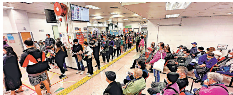
▲醫管局在聖誕假期期間會加開普通科門診，以疏導急症室輪候人龍。

應診的私家醫院、醫療機構、家庭醫生及中醫診所的資料，並與發展局空間數據辦事處和地政總署合作，將相關資料上載至網上平台，供市民參考。醫管局預計，服務需求高峰期特別措施會實施至明年2月9日（農曆年十二）。