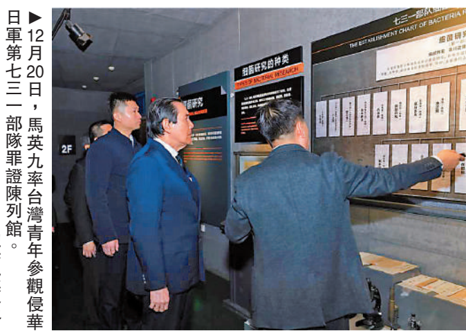
12月20日，馬英九率台灣青年參觀侵華日軍第七三一部隊罪證陳列館。馬英九基金會

【大公報訊】據央視新聞報道：12月20日，正在大陸參訪的中國國民黨前主席馬英九及隨團台灣青年前往黑龍江省哈爾濱市的侵華日軍第七三一部隊罪證陳列館，追憶兩岸共同歷史。