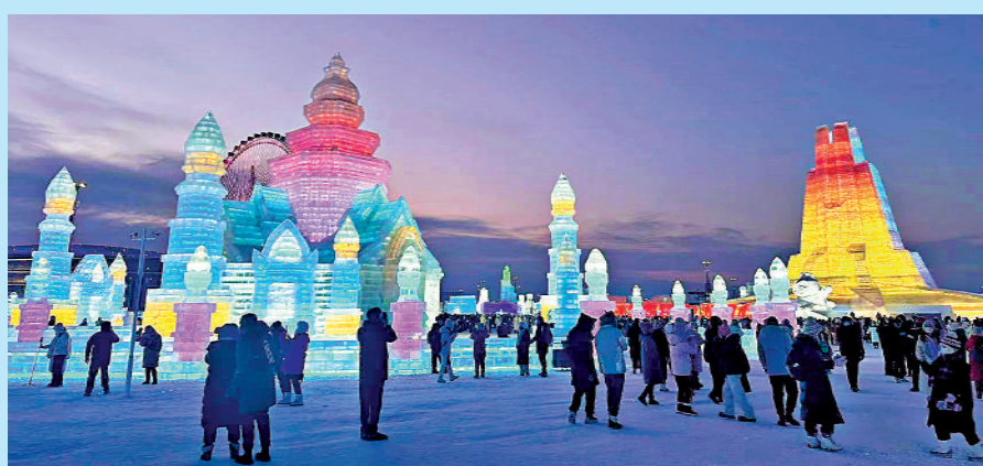
▲冰雪大世界園區面積100萬平方米，總用冰用雪量達30萬立方米。