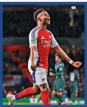
▶ 阿仙奴翼鋒布卡約沙卡。

簡評：這類球員除了邊線活動，更能切入中路射門，因此能輕鬆吸引對方守將盯防而製造空間，如此一來，他們可更輕易傳送予更多空位的隊友攻門。