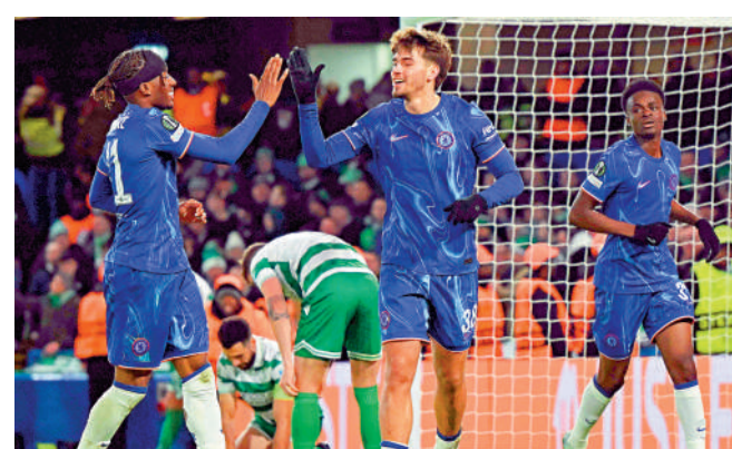
▲ 車路士 (藍衫) 周中派出副選亦在歐協聯大勝而回。

【大公報訊】綜合ESPN FC、香港賽馬會足智彩報道：愛華頓今晚英超主場對車路士，主隊近況差勁兼入球乏力，今季只能力爭護級；車路士踢法漸見隊形，火力更是今季英超之最，預計車路士可以輕鬆擊敗愛華頓，讓球車路士讓半／一仍可投注上盤一博。(NOW622台今晚10時直播)