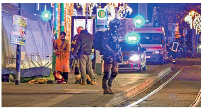
事發後有傷者躺在路邊的擔架上，警察在旁戒備。法新社

目前，德國全國各地的聖誕市集均進一步升級了安保措施，部分城市甚至暫時關閉了聖誕市集。