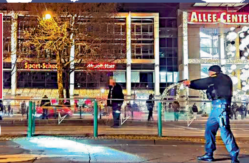
接報到場的警員拔槍，喝令嫌犯下車。視頻截圖

【大公報訊】事發於當地時間20日晚上約7時。目擊者稱，嫌犯駕駛一輛黑色寶馬轎車高速撞向聖誕市集的人群，並以「之」字形在市集橫衝直撞，撞倒多人，死者包括一名女童。接報到場的警員拔槍，喝令嫌犯下車並將其拘捕。