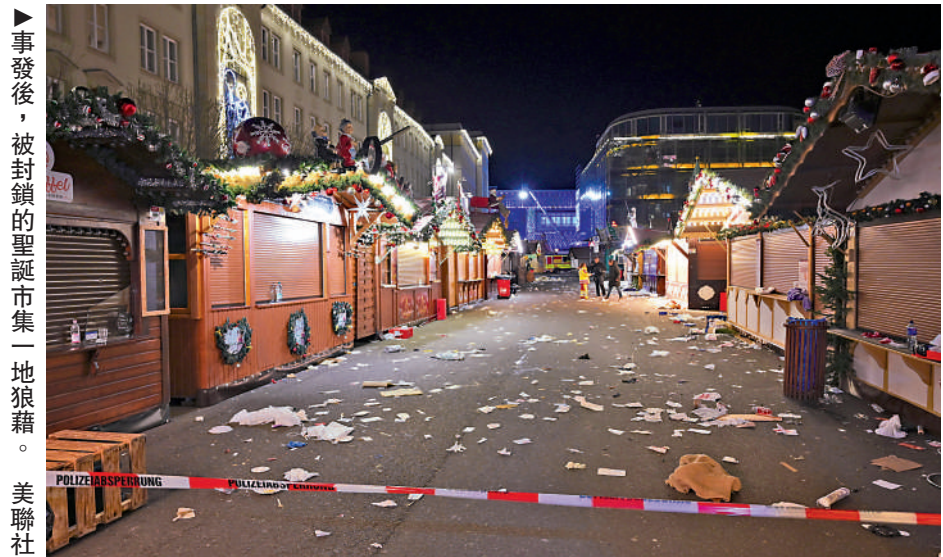
事發後，被封鎖的聖誕市集一地狼藉。