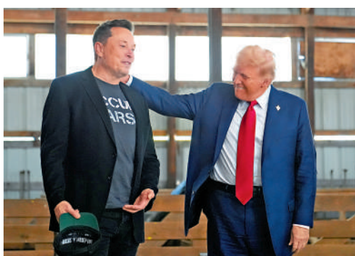
▲馬斯克(左)被視為美國當選總統特朗普的親密盟友。

親商的自民黨籍前財長林德納表示：「雖然控制移民對德國至關重要，但德國選擇黨反對自由和商業，它就是一個極右翼政黨。」