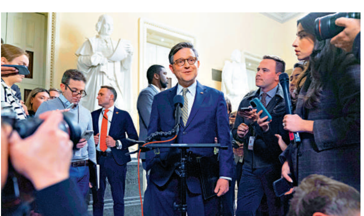
▲美國眾議院通過臨時支出法案後，眾議長約翰遜(中)見記者。

美國聯邦政府最近一次停擺發生於2018年末至2019年初，當時出於特朗普第一任期內。圍繞國會預算案撥款建造美墨邊境牆問題，白宮和國會民主黨人相持不下，造成聯邦政府部分暫停運轉35天，這是美國歷史上持續時間最長的聯邦政府停擺。