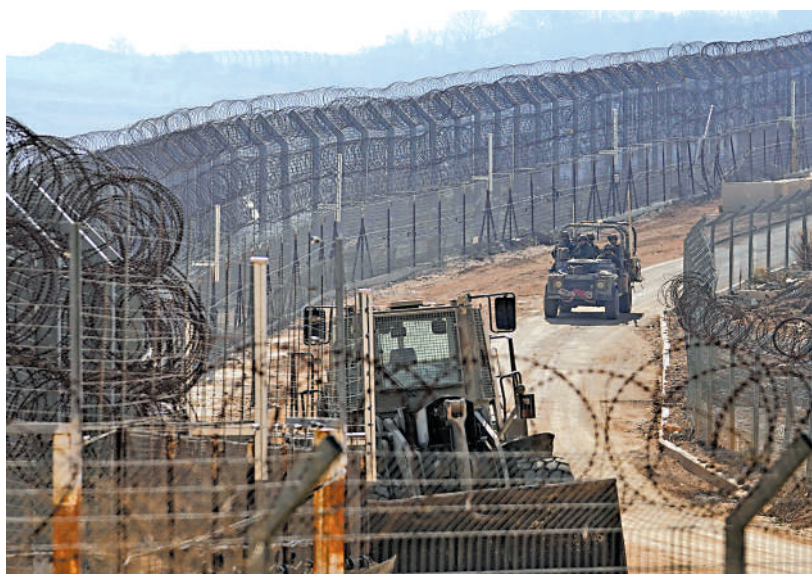
以軍的一輛軍車在戈蘭高地的緩衝區內行駛。