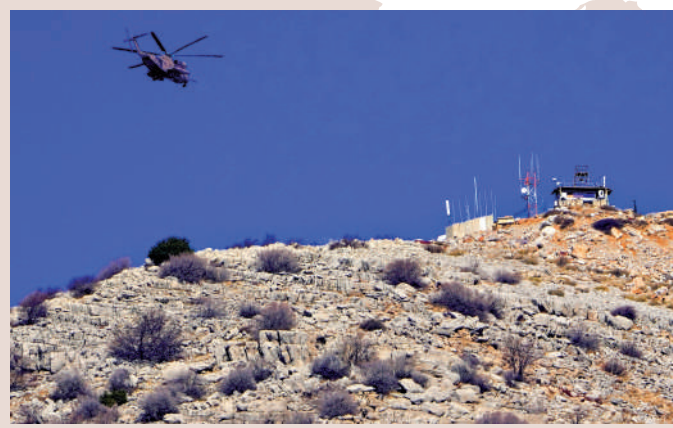
以色列空軍直升機飛越戈蘭高地的赫爾蒙山。