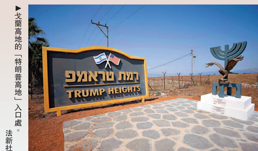
戈蘭高地的「特朗普高地」入口處。