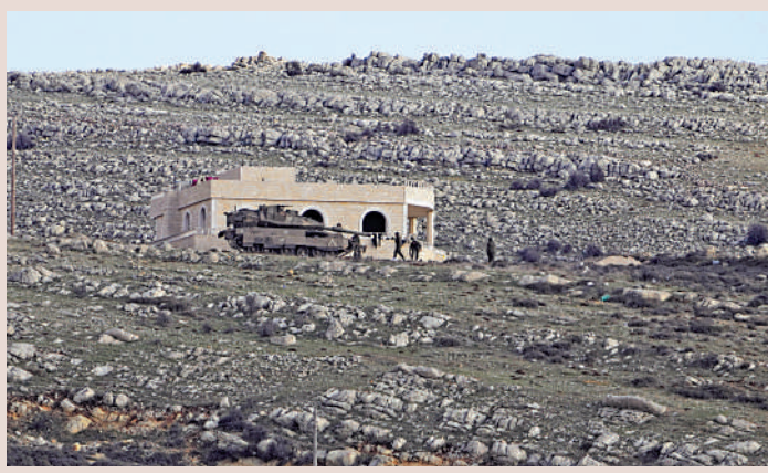
以色列已派兵進入戈蘭高地緩衝區。

敘利亞變天，讓「中東水塔」戈蘭高地再次受到關注。戈蘭高地擁有的水資源，又是戰略要地，以色列過去趁兩次中東戰爭，從敘利亞手中佔領了戈蘭高地大部分地區。巴沙爾政府倒台後，以色列近期除了派軍控制高地的哨所，又推出戈蘭高地人口倍增計劃，外界擔憂以色列可能趁著敘利亞局勢不穩，企圖全面佔領戈蘭高地。