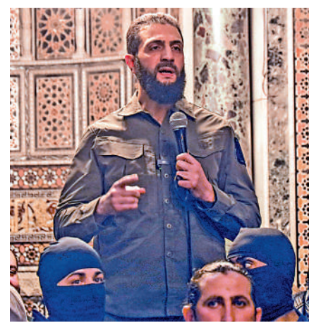
敘利亞反對派領導人沙拉與戈蘭高地有淵源。

美國政府在2013年以沙拉接受「基地」組織領導為由認定他為恐怖分子，並懸賞1000萬美元捉拿他。