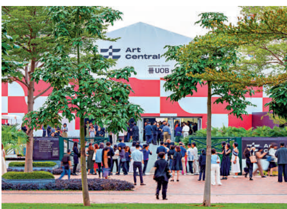
▲Art Central 2025將在中環海濱舉行。

有關Art Central 2025展會節目詳情，包括藝術家、參展畫廊、講座、表演、策展項目等，將於稍後公布。