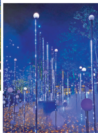
▶六本木 Midtown Garden聖誕燈飾隨音樂變色。

從六本木站出來後，步行數分鐘即到達東京國立新美術館，其外部以波浪形玻璃幕牆建成，綿延160多米，在陽光照射下彷彿波光粼粼。此建築由黑川紀章(1934-2007)設計，從正門入口走進通爽的中庭，會看到兩個巨大的倒錐體，其頂部設有法國餐廳 Brasserie Paul Bocuse Le Musée和咖啡廳 Salon de Thé ROND，後者便是《你的名字。》取景地。坐在其中享用茶點時，就像漂浮在半空般奇妙。