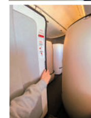
◀趟門設計增加私隱度。

座椅設有多個儲物櫃，位於木紋側桌下方的滑動櫃桶，內部採用人造皮革設計，適合擺放手錶和眼鏡等。另外腳邊地下還有一個較大型的儲物箱，配有小夜燈，方便找東西。側桌內建無線充電器，並備有USB-A、USB-C和電源插座，滿足多個電子產品同時充電。