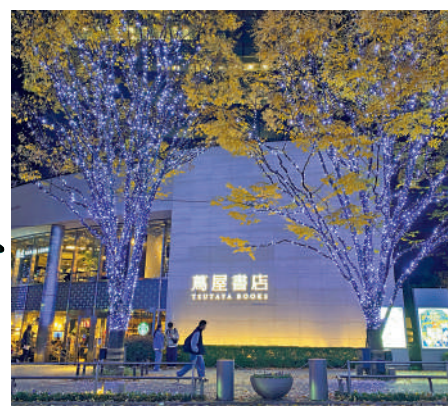
▲六本木蔦屋書店是「夜貓子」好去處。

拾級而上，二樓是有188座的Share Lounge，當時已近十點一刻仍見有人在電腦前「奮筆疾書」。前台告示指共享空間提供座位和包廂，可按小時收費、日租或月租，費用含咖啡茶飲甜點小食自助、熱門書籍免費借閱，甚至還有酒類套餐。這是記者之前在深圳蔦屋書店不曾見過的，如此光明正大「賣空間」倒是新奇。聽店員說，平時「租戶」多是商務人士談正事，或學生自習，可能還有一些遊客需臨時歇腳和充電的。由於離關門不到一小時，店員不建議記者入內消費，「歡迎明天再來！北京蔦屋書店也有Share Lounge哦。」