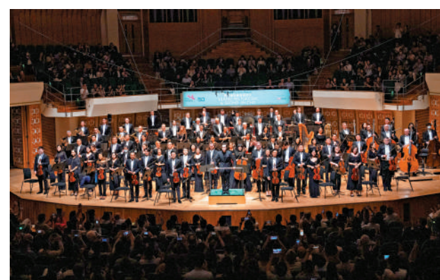
▲香港管弦樂團將於2025年1月於文化中心舉辦一系列音樂會。

現為巴塞隆納塞奧大劇院音樂總監的西班牙指揮龐斯(Josep Pons)，將在「西班牙狂歡夜」為觀眾帶來拉威爾和法雅的作品。音樂會將上演拉威爾的《小丑的晨歌》與《西班牙狂想曲》、法雅的《人生朝露》與《愛情是魔術師》。