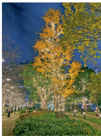
◀Midtown Garden步道上布滿黃色燈飾。