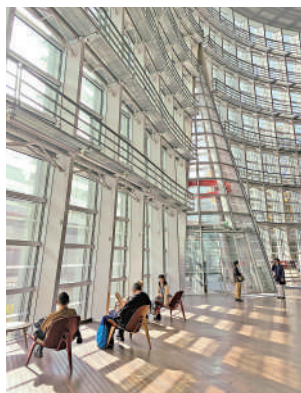
▲東京國立新美術館建築與光影交互。