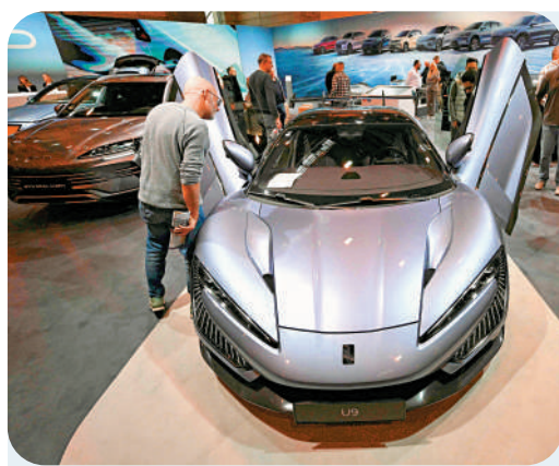
比亞迪在東非地區的發展邁出重要一步。