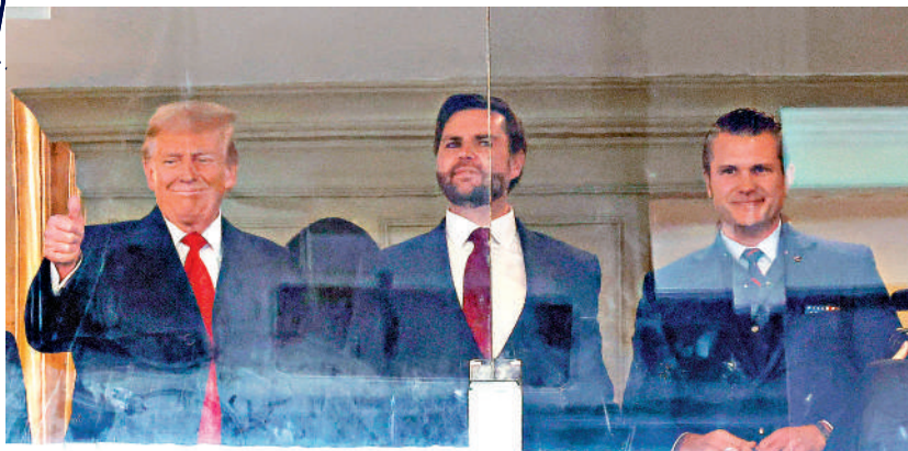
涉嫌性侵犯的防長提名人海格塞斯(右)仍獲特朗普(左)力挺。