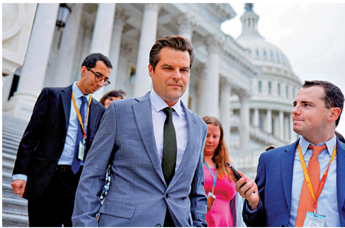
美國共和黨籍前眾議員蓋茨(左)被曝長期買春吸毒。

美國國會眾議院道德委員會23日公布的調查報告顯示，共和黨籍前眾議員蓋茨從2017年到2020年曾向多名女性支付性交易費用，包括一名未成年女性，還經常吸食毒品。美國當選總統特朗普上月提名蓋茨出任司法部長，媒體曝光蓋茨多宗醜聞後，蓋茨放棄了提名並辭去議員職務。然而，同樣涉嫌性侵犯的國防部長提名人海格塞斯仍獲得特朗普力挺。英媒早前稱，醜聞頻發，早已成為包括總統在內的美國政客的常態。