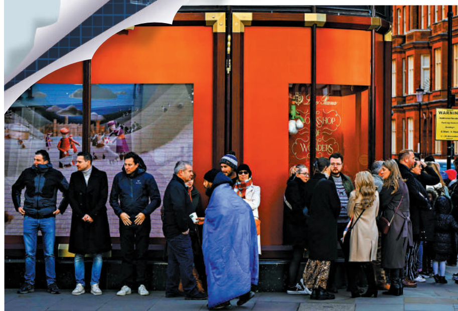
▲英國經濟第三季度零增長，民眾預計將減少開支。