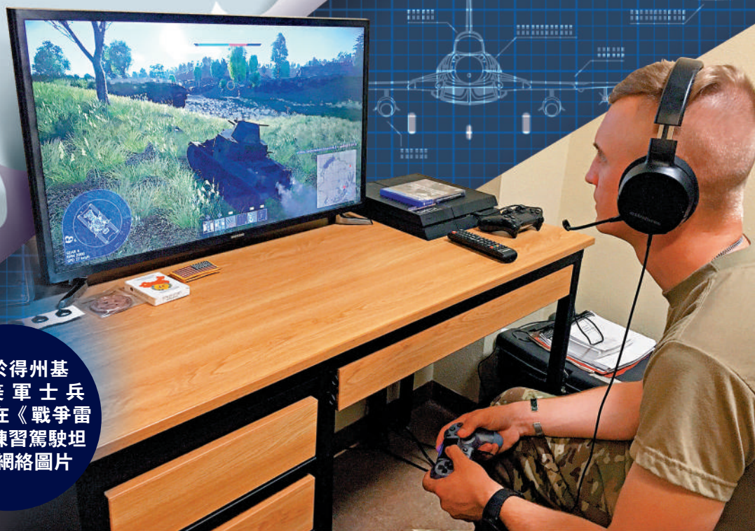
▶位於得州基地的美軍士兵2020年在《戰爭雷霆》中練習駕駛坦克。