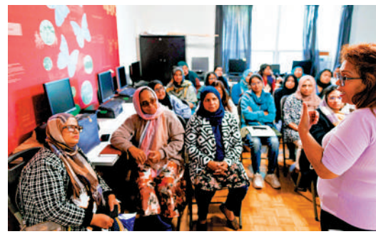
▲加拿大移民權益組織10月30日為新移民提供職業技能培訓。

更進一步。加媒揭露，不法分子在社交媒體上出售LMIA文件和符合LMIA要求的工作機會，價格為2.5萬至4.5萬加元(約13.5萬至24.3萬港元)。新