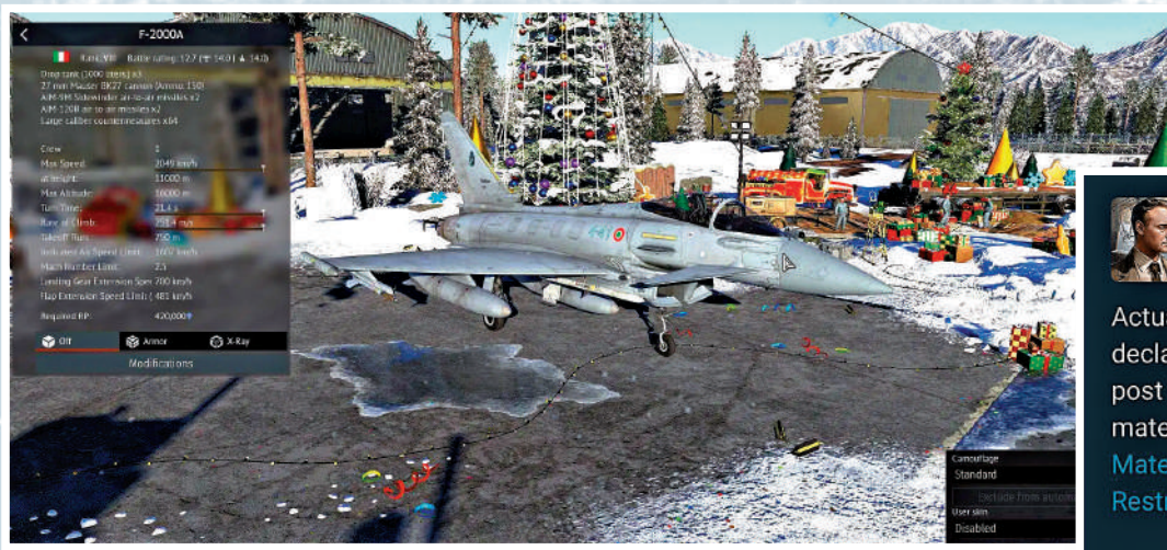
◀《戰爭雷霆》玩家可在遊戲中操作「颶風」戰機等載具。網絡圖片

歐洲網絡遊戲《戰爭雷霆》近日再次捲入洩密風波。英媒23日報道稱，一名玩家為贏得與其他玩家的爭論，將有關歐洲「颶風」戰機的涉密文件上傳至遊戲論壇，驚動意大利國防部。論壇管理人員迅速刪除這些文件並封禁涉事賬號。美媒指出，社交媒體和遊戲網站已成為洩密重災區，同時也是反間諜工作的新焦點。據悉，美國間諜機構在《魔獸世界》等網絡遊戲中創建賬號進行監視。