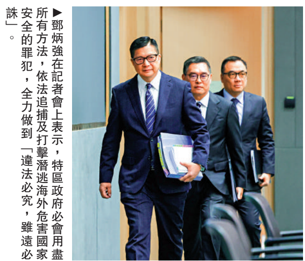
鄧炳強在記者會上表示，特區政府必會用盡所有方法，依法追捕及打擊潛逃海外危害國家安全的罪犯，全力做到「違法必究，雖遠必誅」。

警務處國家安全處指出，新增的6名通緝人士，竄逃外地後涉嫌干犯香港國安法下的罪行，包括「煽動分裂國家罪」、「顛覆國家政權罪」及「勾結外國或者境外勢力危害國家安全罪」，警方遂依法向法院申請拘捕令，並通緝有關人士。警方高度重視該案，現就每名被通緝人士懸紅港幣100萬元賞格，呼籲市民就有關上述人士或相關案件提供消息。