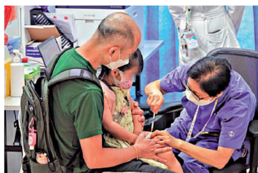
▲專家預測，流感個案最快下月起大幅上升，建議適時接種疫苗。

留意到流感、新冠病毒、呼吸道合胞病毒等求診個案都有所上升，另外亦有頻繁參加社交聚會的市民出現腸胃炎，呼籲市民注意個人衛生，如感到不適應盡快求醫。林永和又提到，日本和美國等地的流感個案近日有所上升，本港亦有市民在外遊後感染甲型流感，或會導致香港爆發流感，建議市民在外遊時可帶備藥物傍身。