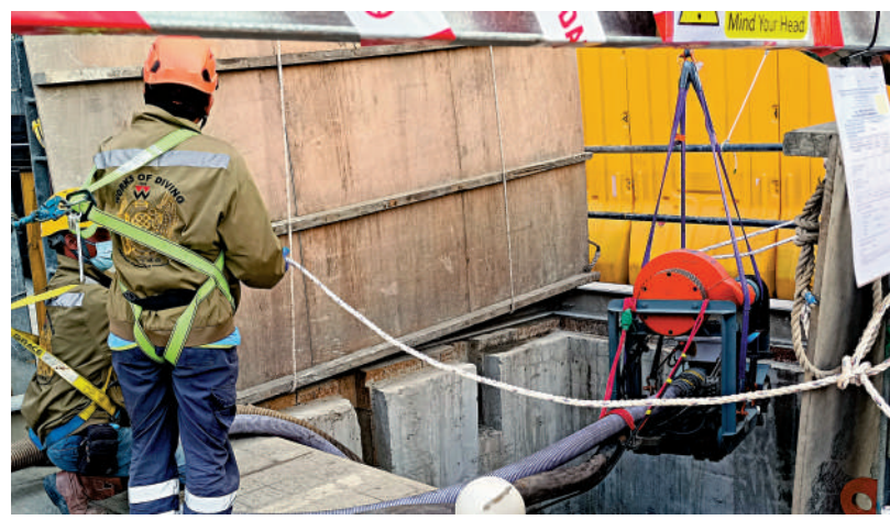
▲工作人員進行渠管修復工程。

老舊渠管滲漏，甚至錯駁嚴重，生活污水錯經雨水管道排放入海，既污染海岸又有惡臭影響居民。為改善維港水質和氣味問題，政府前年起在多區重點治理，從污水口向上尋找、修復渠管錯駁源頭。