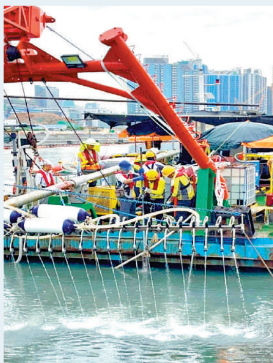
▲工作人員以生物除污法處理海床的污染沉積物。

環保署表示，深水埗污水渠錯駁修復工程逐步接近完成，現正邁向「上游正本清源」目標，未來期望利用多項科技，實現「下游清淤除臭」。渠務署表示，會定期為該區主要箱型雨水渠進行清淤和清洗工程，清除沉積物釋放的殘留氣味。渠務署由今年第一季開始，於東