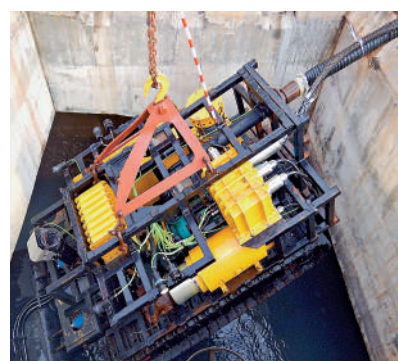
▲渠管工人利用吊機將清淤箱型雨水渠