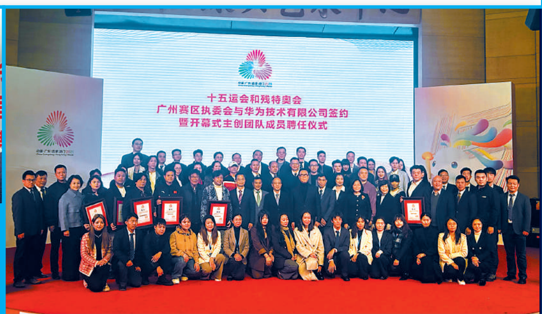
▶十五運開幕式主創團隊成員合照。大公報記者敖敏輝攝