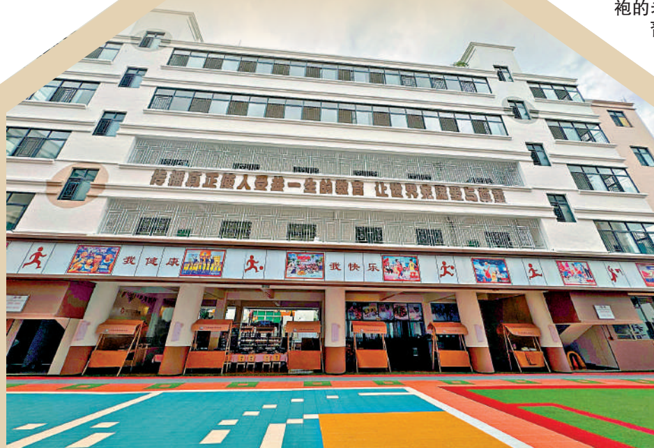
▲花都育德幼兒園的一至三層仍保留幼兒教學功能，四、五層則翻新改造為「銀髮學堂」。

五年前，記者曾採訪過黃吉海，當時他的老年教育集團在廣州僅有12個校區。如今，類似校區已增至103家，覆蓋全國32個城市，規模擴張近十倍。黃吉海自信地表示：「還有20多家校區正在籌建中。」對於曾經在幼教行業內打拚的園長們來說，他們也許從未想過，有一天幼兒園會迎來這樣的「新生命」。