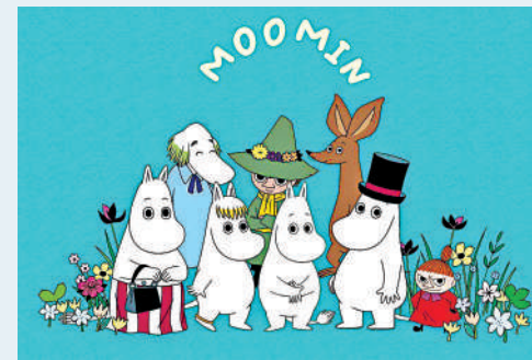
▲姆明一家是芬蘭的文化象徵之一。

個芬蘭人的童年中佔有重要地位，因為它代表芬蘭的精神與國家認同。姆明的故事不僅存在於文字中，還被改編為多部動畫作品，並在世界各地贏得了無數粉絲。芬蘭楠塔利市鎮還建有以姆明為主題的公園——姆明世界，成為遊客們感受童話魅力的最佳場所。