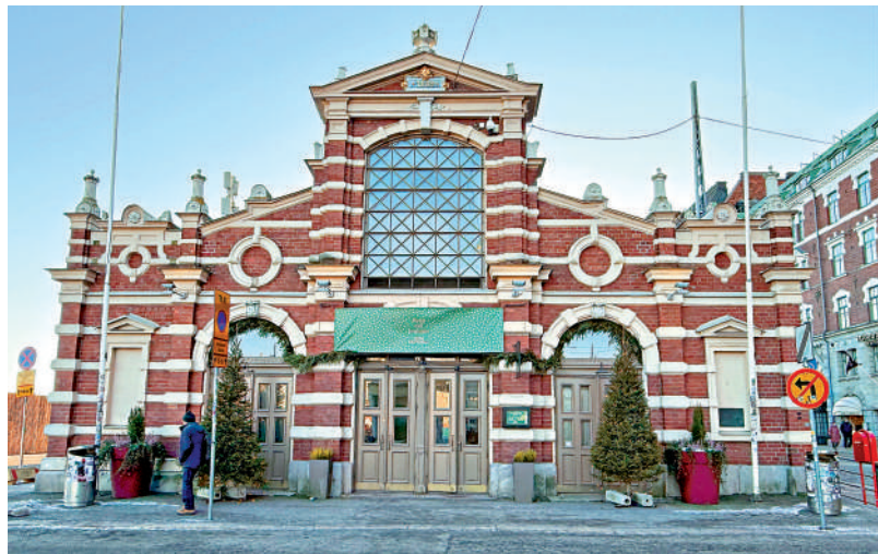
▲赫爾辛基老農貿市場。