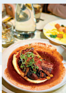
▲芬蘭傳統美食鹿扒。