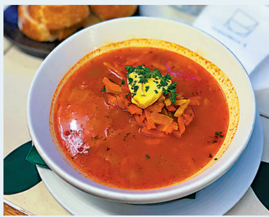
▲老農貿市場內的三文魚湯。

「Soup+More」是市場中一間只賣湯的小餐廳，但總是能見到客人在門口排隊。它張貼在店門口的宣傳語和這裏的魚湯一樣暖心：Soup is more than just soup. It's a bowl full of warmth—served with a smile.