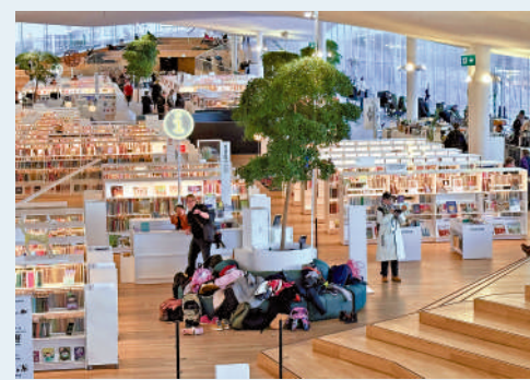
▲赫爾辛基頌歌中央圖書館內景。

正是這樣健全的設施和開放的氛圍，讓赫爾辛基的圖書館成為市民生活的一部分。在這裏，人們不僅僅是讀書，而是學習、創作、交流，休閒、放鬆。對芬蘭人來說，圖書館不再只是求知的場所，而是城市生活的一個縮影，是連接人們與未來的樞紐。