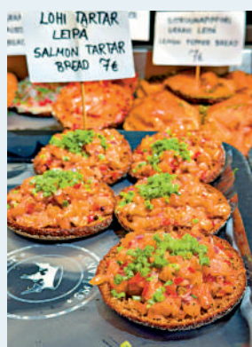
▲老農貿市場內的美食。