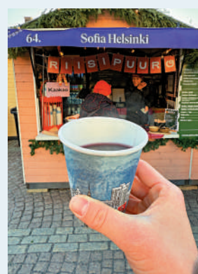
▲在市集喝一杯熱紅酒。