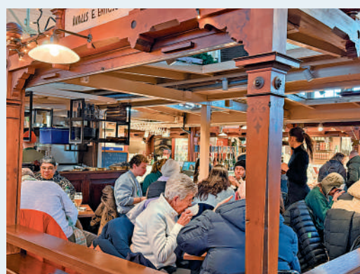
▲老農貿市場內的餐廳客人絡繹不絕。

在白教堂門前的聖誕集市中，無論是當地居民還是遊客，都手捧熱紅酒，分享著彼此的歡笑。聽到廣播中的當地主持人說：「聖誕不只是一個節日，更是一種感受。」這句話在赫爾辛基得到了最好的詮釋。