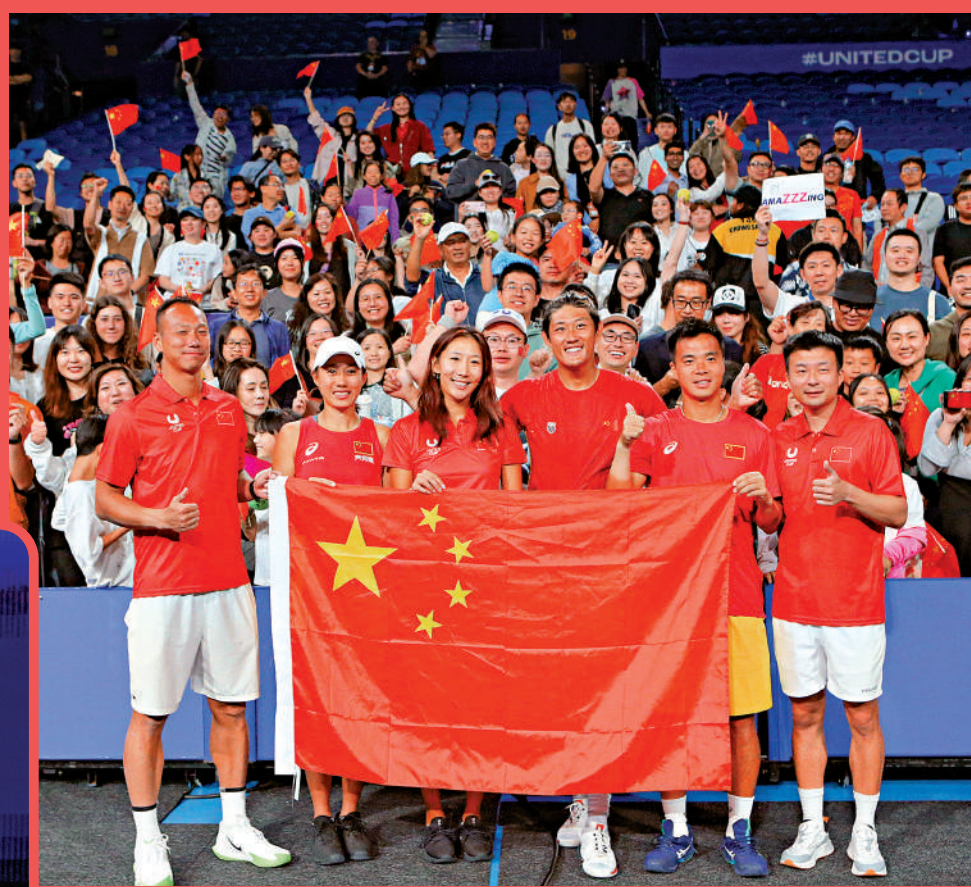
▲中國隊總分3:0戰勝巴西隊，賽後與觀眾合影。