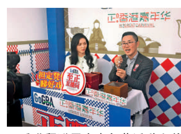
香港貿發局在嘉年華活動上首設直播間，助力港企拓內銷。