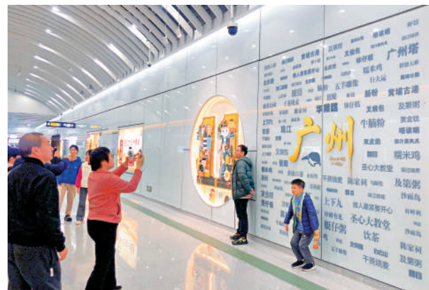
內拍照留念。廣州市民在11號線地鐵站。