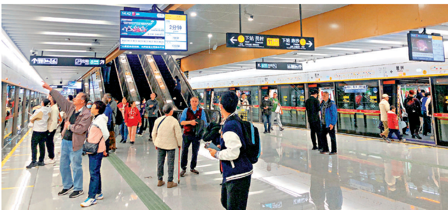
12月28日，廣州地鐵11號線開通通車。11號線共設31座車站，其中換乘站達26座，被譽為「換乘之王」。