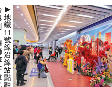
廣州地鐵11號線沿線車站點融入粵劇、醒獅等非遺元素。

胡小姐在體驗11號線後，對地鐵站內「人性化」的設施讚不絕口，例如沿線車站均設置了母嬰室、公共衛生間、第三衛生間等設施，裝置了智能客服中心低位服務台、嬰兒護理台、哺乳間、洗手池、兒童坐便器、低位洗手盆等便捷設備，為母嬰群體和市民出行帶來更多便利。同時，各站均設有輪椅坡道、寬通道開機，列車上線特大號線網圖，重點車站設有大界字換乘導向，能更好地解決適老化和無障礙的問題。