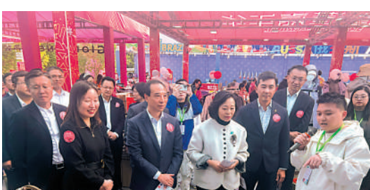
民眾在嘉年華活動上「掃」港貨，收獲滿滿。

【大公報訊】記者敖敏輝東莞報道：一連7日，東莞迎來港風、港味、港貨大匯聚。為支持港企拓展內銷市場，促進港莞經貿交流，「正!香港」嘉年華活動27日下午在東莞啟動。活動28日起全面對公眾開放，又恰逢周末，吸引大量來自大灣區的市民遊客。