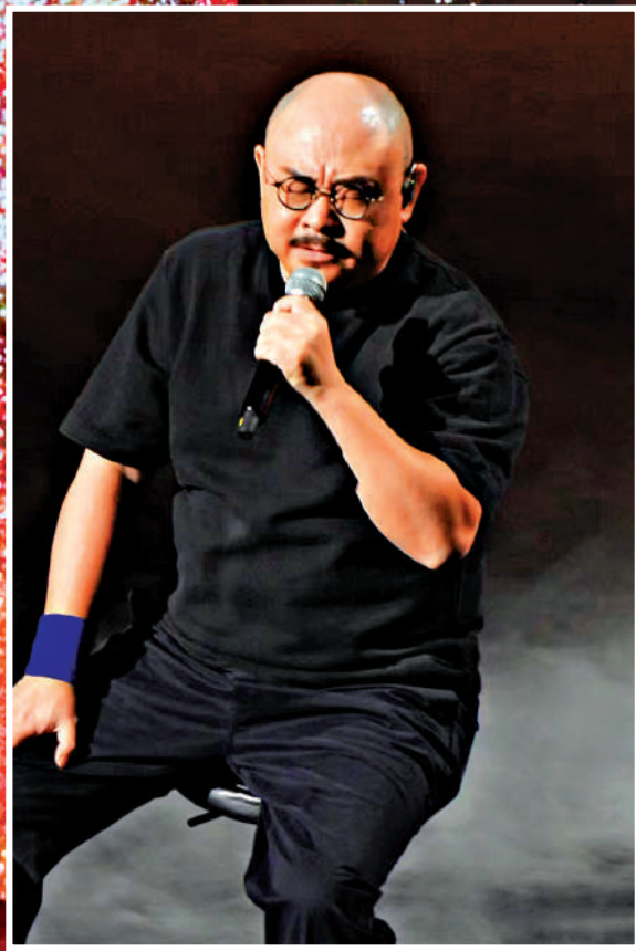
◀刀郎今年巡演的最後一場昨日在北京華熙LIVE·五棵松場館舉行。