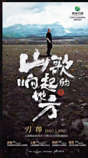
▲刀郎2025年演唱會海報。