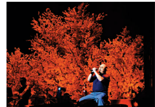
▲刀郎的歌曲具有濃郁的煙火氣息。

「我是搶到票的，但是想着距離演唱會還有一段時間，就先來這裏湊湊熱鬧。」一位中年大姐對《大公報》說，感覺這些「刀迷」自發地就