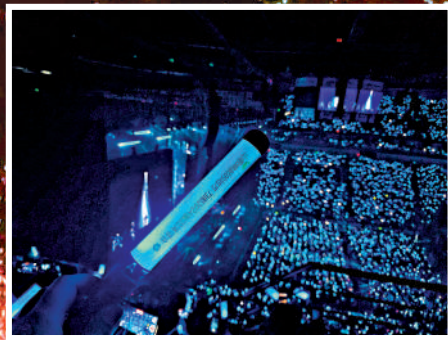
▼刀郎演唱會現場座無虛席。