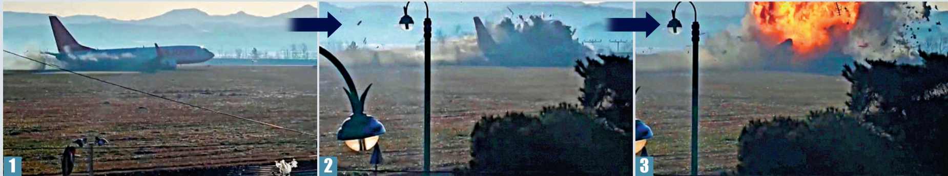
▲濟州航空客機29日在降落時衝出跑道，撞上圍欄外牆起火。

韓國濟州航空載有181人的7C2216號客機29日發生致命空難，其中179人身亡、僅2人生還。該客機在降落過程中疑似遭遇鳥擊，飛機以機腹著陸，最終偏離跑道，以高速撞破圍欄外牆後爆炸起火。本港專家表示，客機撞到雀鳥與起落架未能正常放下並無直接因果關係，而駕駛艙亦可手動解鎖打開起落架，認為事件不尋常。不少航空專家認為，此次墜機事故疑點重重，或由多重原因造成；鳥擊令民航機墜機且發生如此大規模的災難不常見，濟州航空的緊急事故處理很可能存在問題。 大公報記者 義昊 郭嘉