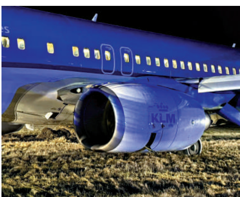
▲荷蘭皇家航空一架波音737-800客機衝出跑道。