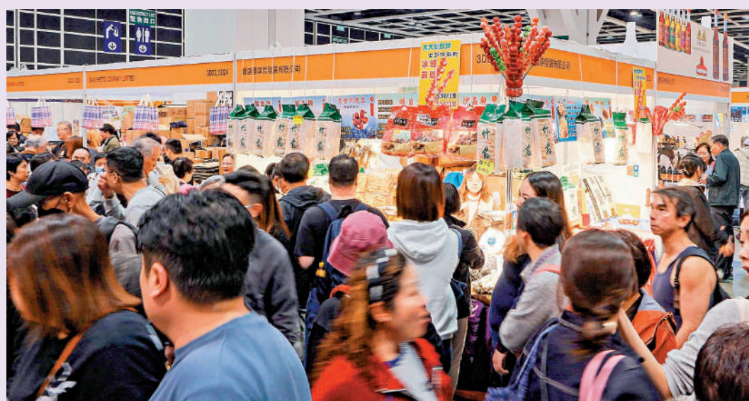
▲冬日美食節昨日最後一天舉行，大批市民入場選購年貨。

有參與商戶形容，受惠於深圳居民「一簽多行」恢復，更多內地旅客進場，今年銷情理想。廣昌隆已是第八次參加冬日美食節，負責人許先生指生意較去年增加三成左右，又說來年會繼續參與美食節。另一些商戶則反映聖誕期間多區都有活動，加上市民外遊及北上消費，分散客源，影響生意。