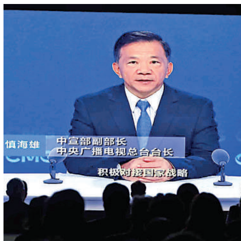
▲慎海雄以視像致辭時指出，全球發展最大的機遇在中國，香港發展最大的機遇在內地。

澳大灣區作為中國最具發展潛力的地區之一，香港在其中具有獨特的優勢與作用。他認為，香港如今不僅僅是國際金融中心、貿易中心、物流中心，璀璨的科技創新之光也正在這裏加速綻放，香港的新興產業展現出蓬勃的創新活力，為全球企業提供了新的發展機遇。