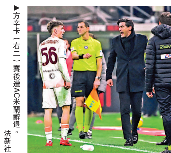
▲方辛卡(右二)賽後遭AC米蘭辭退。

同日稍早舉行的另一場意甲，由祖雲達斯主場迎戰費倫天拿，儘管卡夫蘭杜林梅開二度，但祖雲達斯最終與對手踢成2：2平手。取得1分後，祖雲達斯現以18戰得32分排積分榜第6位，雖然仍屬今季唯一不敗之師，但多達11場比賽摸和對手，爭標形勢處於下風。