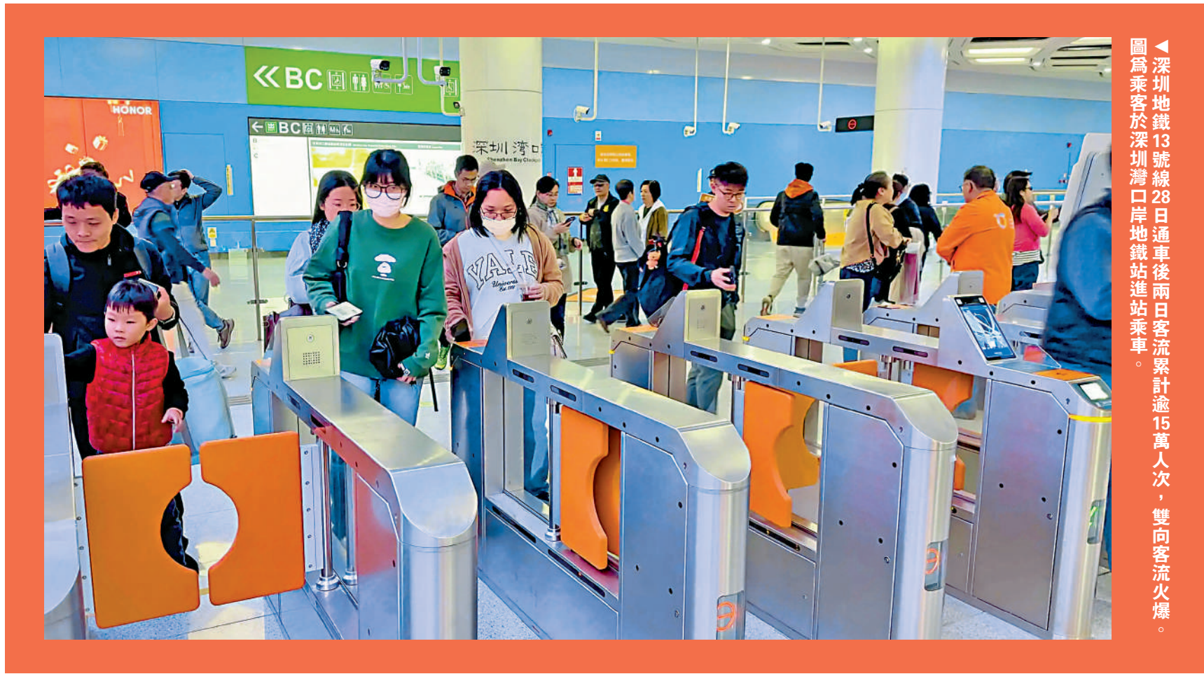
深圳地鐵13號線28日通車後兩日客流累計逾15萬人次，雙向客流火爆。圖為乘客於深圳灣口岸地鐵站進站乘車。