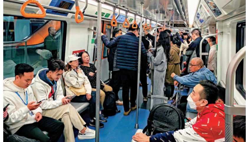
13號線開通後受到市民及遊客歡迎。大公報記者郭若溪攝