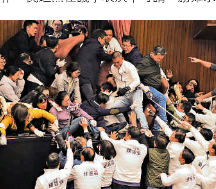
▲台灣立法機構經常爆發嚴重肢體衝突，藍綠「立委」打成一團，成為輿論的笑柄。

1月13日大選開票結束，民進黨憑「賴蕭配」勝選打破台灣政黨8年執政魔咒，卻失去立法機構第一大黨的地位。在野的中國國民黨與台灣民眾黨一共奪得60席「立委」，超過半數，只要藍白「立委」堅定合作，民進黨在議事表決中可謂一勝難求。