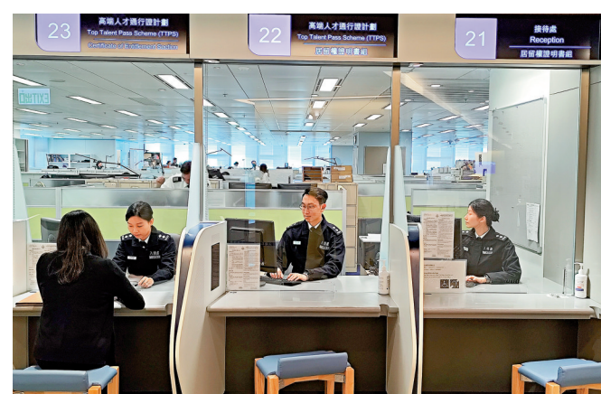
▲入境處提醒高才通申請人留意延長逗留期限申請期限。大公報記者古偉勳攝