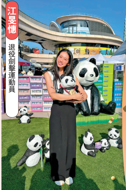
江旻憓 退役劍擊運動員