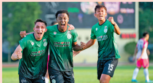
▲大埔今季在港超愈戰愈勇，有力挑戰聯賽冠軍。

「大埔以港超榜首完結2024年，我覺得滿意，不過接下來是怎樣去部署又是另一回事，始終今季是三循環，賽程很長，我們開季目標是前三甲，當然我希望可以爭取到第二位。我覺得今屆前列球隊都很平均，譬如傑志季初運作未調節好，但你見到他們總有能調節，是有實力的，肯定會想重返前列。而理文始終資源較豐富。三循環的比賽，每隊肯定有失準的時候，但始終聯賽是有時間讓你追。我希望大埔能保持水準。最後祝大家新年進步，亦希望大埔能夠踢好波，更上一層樓。」