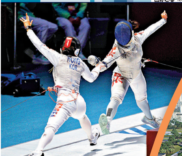
▲全運會劍擊項目賽事將由香港承辦。