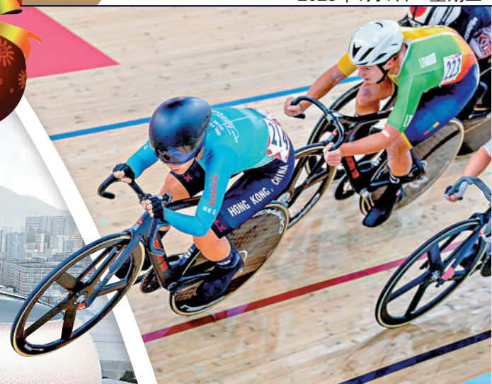
▲全運會場地單車項目將由香港承辦。