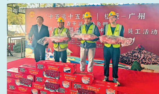
▲建築工人獲贈查干湖冬捕魚。