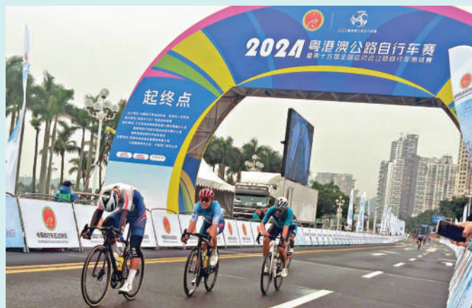
▲全運會男子公路單車賽將創新通關模式。

年12月初開賽。郭振明指出，通過十五運會將廣東、香港、澳門籃球的群眾賽事、職業聯賽進一步豐富完善，進而在國內起到龍頭引領和示範作用，讓其他省市來學習和借鑒大灣區籃球賽事的體系和基礎，從而促進全國籃球運動的普及和發展。