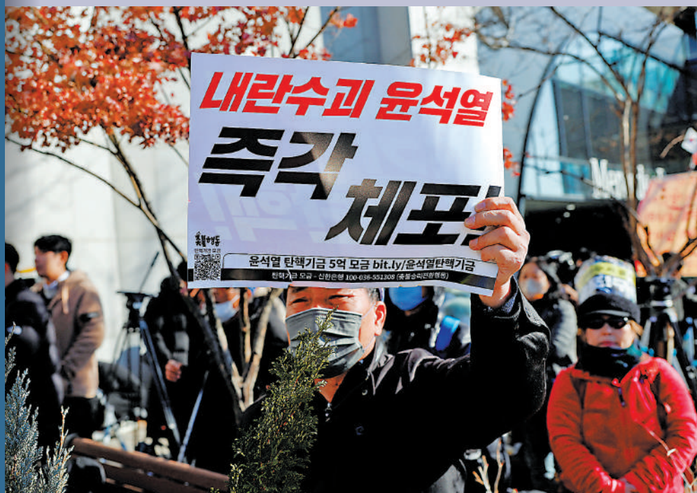
▲尹錫悅反對者在總統官邸外舉着「立即驅逐並逮捕尹錫悅」的橫幅。