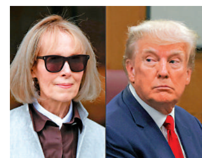
▲美國總統當選人特朗普（右）誹謗及性侵犯前專欄作家卡羅爾案上訴失敗，仍需賠償500萬美元。

此外，在另一起卡羅爾起訴特朗普的名譽誹謗案件中，卡羅爾指控特朗普否認強姦罪行嚴重影響其作為專欄作家的聲譽，甚至導致自己遭受死亡恐嚇，要求法庭加重懲罰。紐約南區聯邦法院陪審團於2024年1月26日裁定，要求特朗普支付卡羅爾總計8330萬美元（約6.49億港元）的誹謗賠償金和罰金。特朗普對此案裁決的上訴仍在處理過程中。