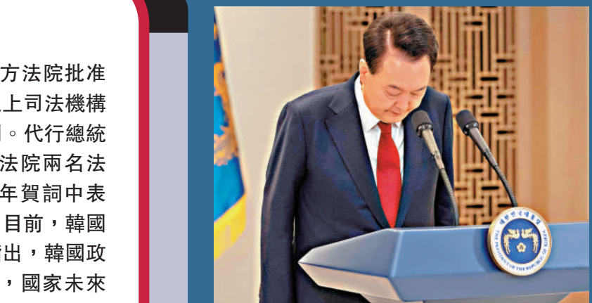
▲韓國法院周二對總統尹錫悅發布逮捕令，這是韓國憲政歷史上首次。

憲法院預計將在2025年6月前作出判決。分析指出，在尹錫悅相關問題上朝野仍對立嚴重，雖然崔相穆在法官任命問題上稍作妥協，但仍面臨下台的壓力，韓國在2025年政治動盪還將持續。崔相穆周二發表書面新年賀詞時說，韓國正面臨「前所未有的嚴峻局勢」，政府將盡全力穩定國政運行。