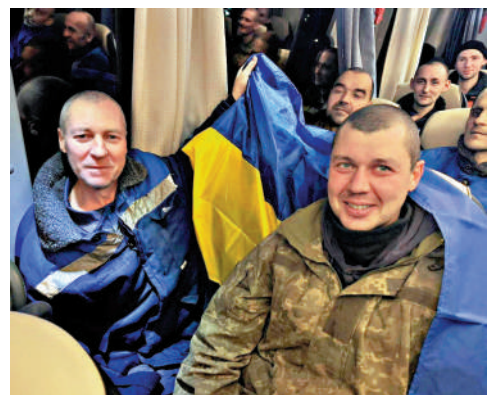
▲俄烏在跨年夜前交換300名戰俘。

當地時間周一，俄烏在2025年新年前夕進行大規模交換戰俘，涉及300人。這是俄烏雙方第59次交換戰俘，也是迄今為止最大規模的一次。俄羅斯國防部表示，150名俄軍人從烏克蘭控制的領土被送回俄方；作為交換，俄方向烏克蘭移交了150名烏軍人。阿聯酋為推動此次換俘行動進行斡旋。