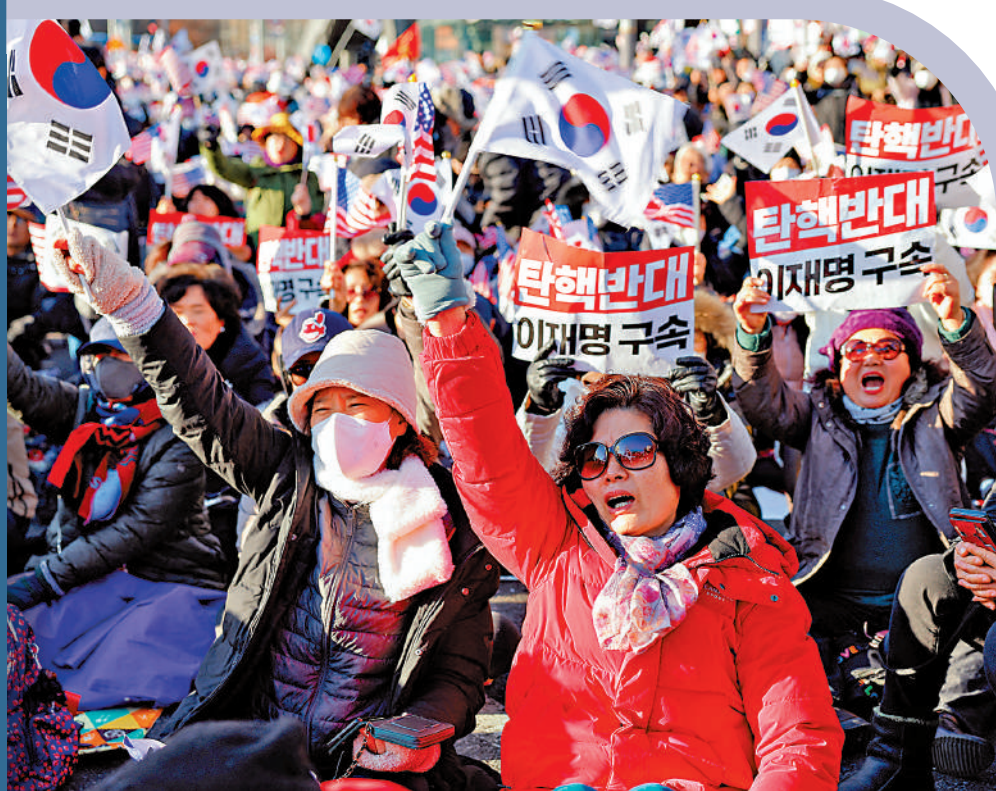
▲當地時間周二，尹錫悅支持者在總統官邸外抗議法院批准對尹錫悅的逮捕令。