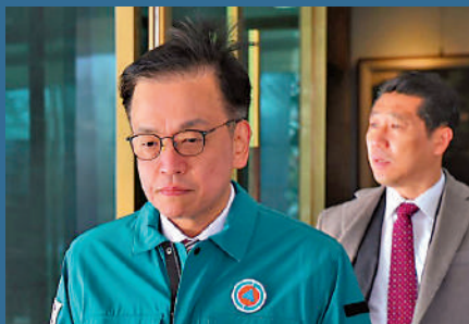
▲韓國代總統崔相穆面臨下台壓力。網絡圖片

2024年12月31日 韓國檢方以涉嫌「內亂共謀罪」，對韓國國防部前反間諜司令官呂寅兒、首都防衛司令部司令官李鎮雨進行拘留起訴。