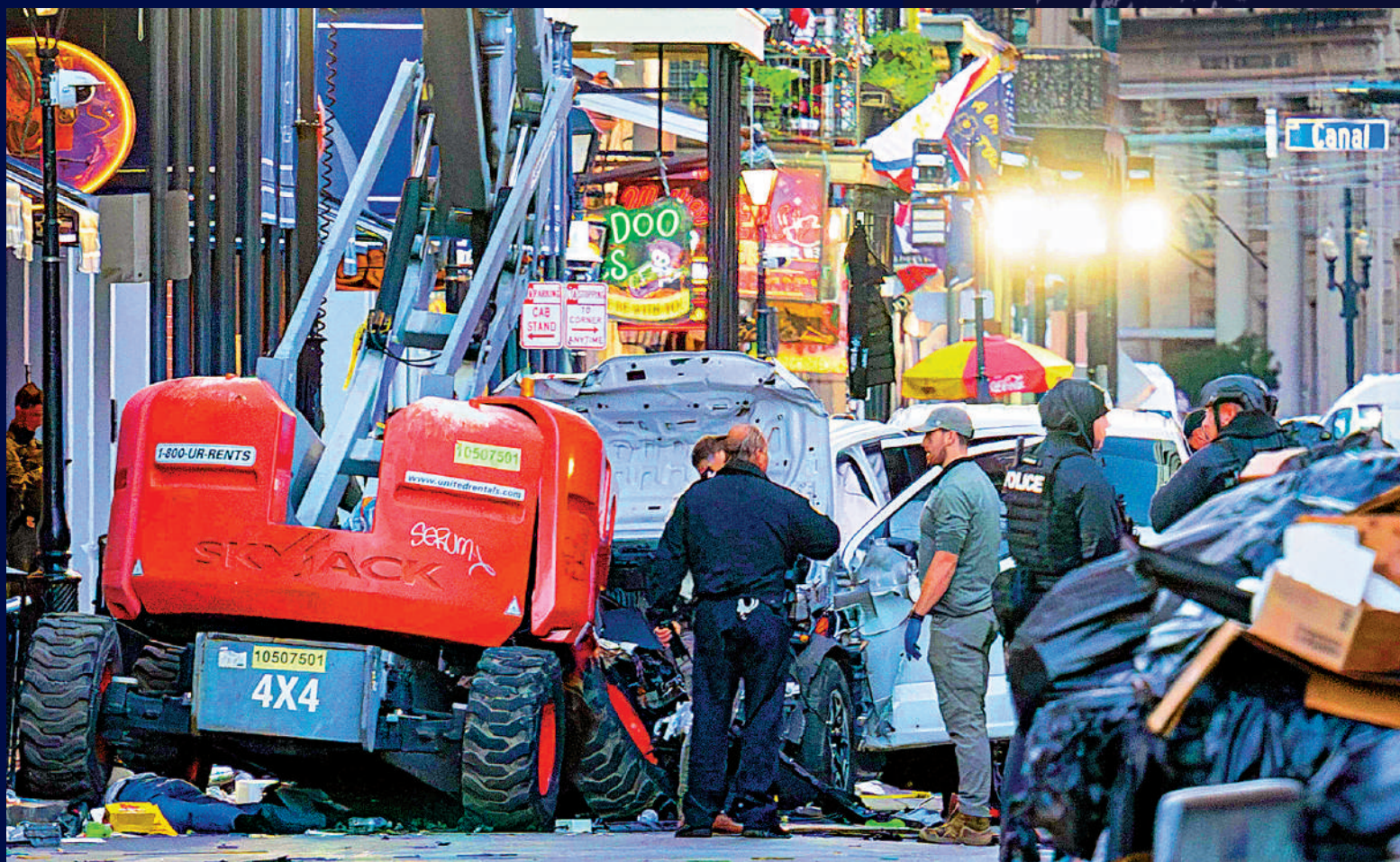
警方在肇事車輛旁進行取證調查。

美國路易斯安那州新奧爾良市1月1日凌晨發生貨車衝撞人群事件，截至本港時間2日凌晨，已造成至少10人死亡、超過35人受傷。司機在衝撞人群後下車開槍，警方進行還擊，兩名警察被打傷，司機死亡。執法部門在現場檢獲至少一個自製簡易爆炸裝置。新奧爾良市長坎特雷爾稱，這是一起「恐怖襲擊」。美國聯邦調查局（FBI）隨後表示，將循「恐襲」方向進行調查。