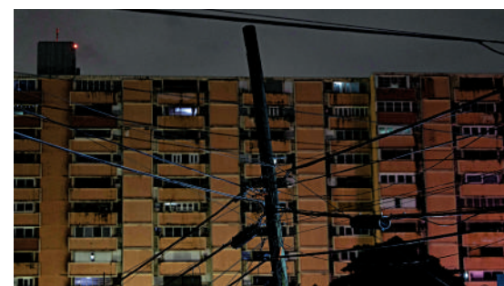
▲2024年12月31日晚，波多黎各約90%用戶斷電。

截至當地時間2025年1月1日凌晨3時，波多黎各仍有超過30%用戶無電可用。供電中斷後，一些用戶只能啟用自備發電機維持供電。