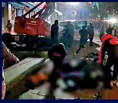
警員到場封鎖周邊道路。

2025年1月1日 當天凌晨，一名司機在美國路易斯安那州新奧爾良市駕車故意撞向人群，隨後下車開槍，並與警方交火。事件已造成至少10人死亡、超過35人受傷。新奧爾良市市長坎特雷爾稱事件為「恐怖襲擊」。