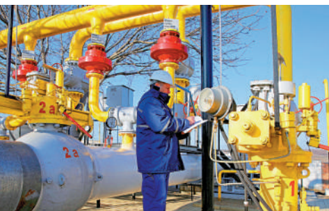
▲俄停止經烏向歐洲輸氣，引發東歐國家擔憂。圖為摩爾多瓦配氣廠員工在工作。

烏總統澤連斯基日前表示不再延長與俄方相關協議，引發斯洛伐克、匈牙利等歐盟成員國對於能源供應的擔憂。斯洛伐克總理菲佐1日稱，事件