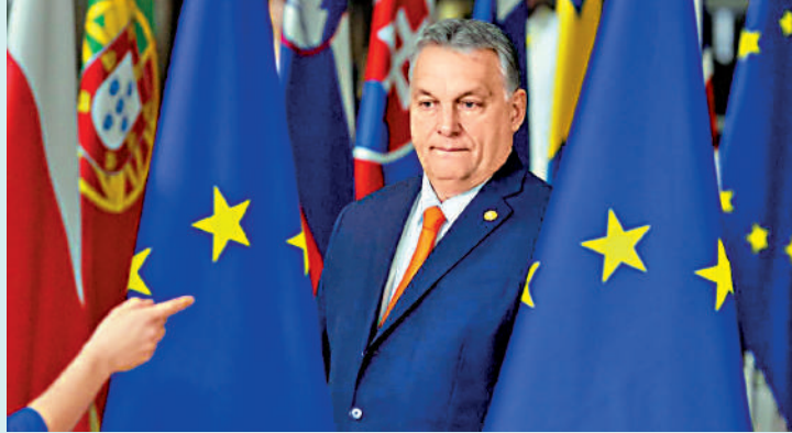
直不陸。匈牙利總理歐爾班與歐盟關係一網絡圖片

【大公報訊】據《金融時報》報道：歐盟以不滿匈牙利的法治狀況為由，凍結了原本撥給該國的63億歐元資金。2025年1月1日，匈牙利「永久失去」其中10.4億歐元（約84億港元）的資金，因為這筆錢應在2024年底前支付，否則會到期。分析指，歐盟此舉或對匈牙利經濟造成嚴重打擊，可能影響匈牙利總理歐爾班的連任之路。