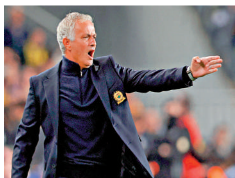
▲摩連奴希望在費倫巴治取得事業新突破。

英超球隊曼聯和熱刺，2021年轉赴意甲帶領羅馬，第1季即贏得首屆開設的歐協盃，之後球季晉升歐冠盃亦殺入決賽，可惜互射12碼不敵「歐霸之王」西維爾；賽後他在場外怒罵該仗球證安東尼泰萊，結果被罰停賽4場，也成為摩連奴的第2個遺憾。摩連奴說：「我遺憾的並非是和泰萊衝突，而是後悔自己怎麼不直接離開而待在那裏向他大興問罪之師。」摩連奴最終亦於去年初被炒，今季轉當土超費倫巴治主帥。