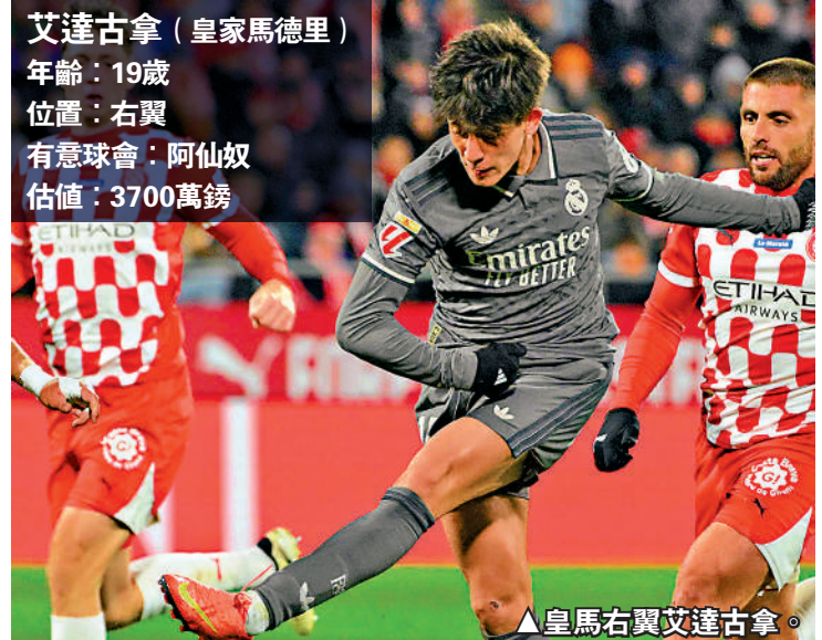
▲皇馬右翼艾達古拿。

紐奴文迪斯 (巴黎聖日耳門) 年齡：22歲 位置：左閘 有意球會：曼聯 估值：4600萬鎊