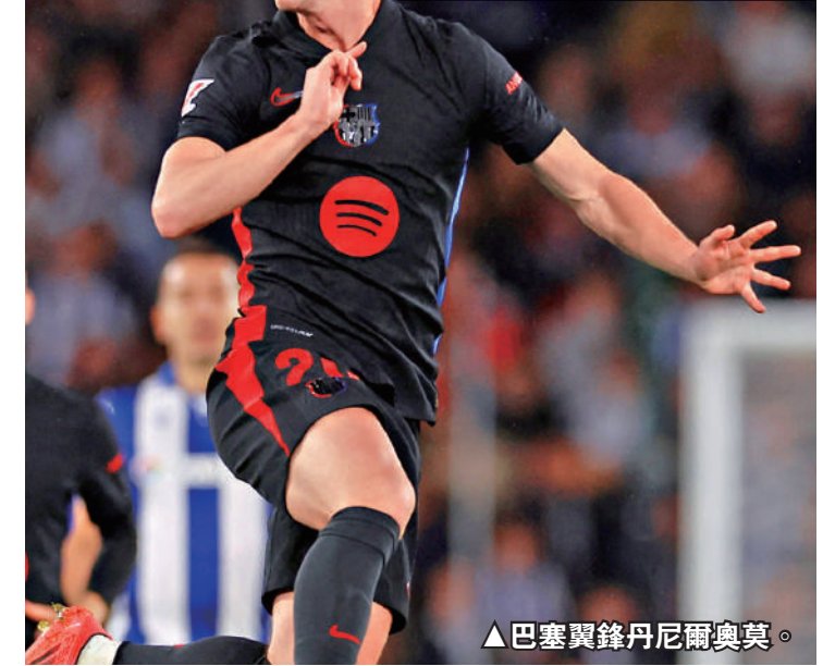
▲巴塞翼鋒丹尼爾奧莫。

丹尼爾奧莫 (巴塞隆拿) 年齡：26歲 位置：進攻中場 有意球會：曼城、拜仁慕尼黑、巴黎聖日耳門等 估值：5000萬鎊