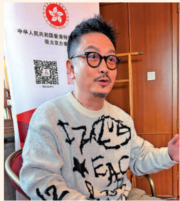
▲謝君豪主演粵語版《天下第一樓》。