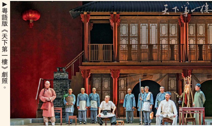
▲粵語版《天下第一樓》劇照。

何冀平說，自己非常期待未來香港與內地文藝界能夠有越來越深入的交流合作。這一次粵語版《天下第一樓》在京首演，自己也會去看，並且認真感受京城觀眾對這部作品的評價。何冀平還透露，自己還為越劇名家茅威濤創作了劇本《蘇東坡》，今年4月就能與香港觀眾見面，這也是香港與內地文藝交流的又一次積極嘗試。