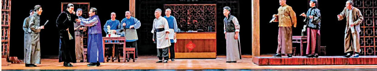
▲粵語版《天下第一樓》將在北京天橋藝術中心上演。